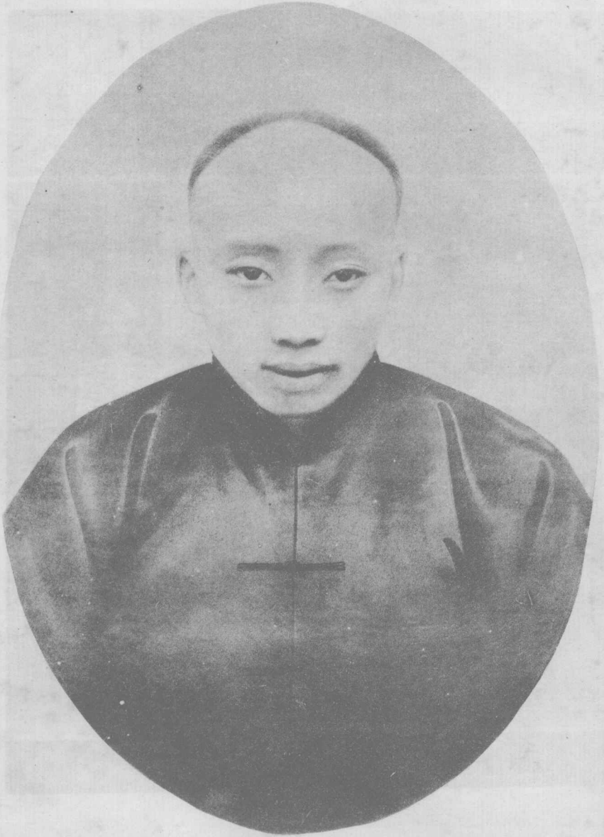
影 小 時 學 文 究 研