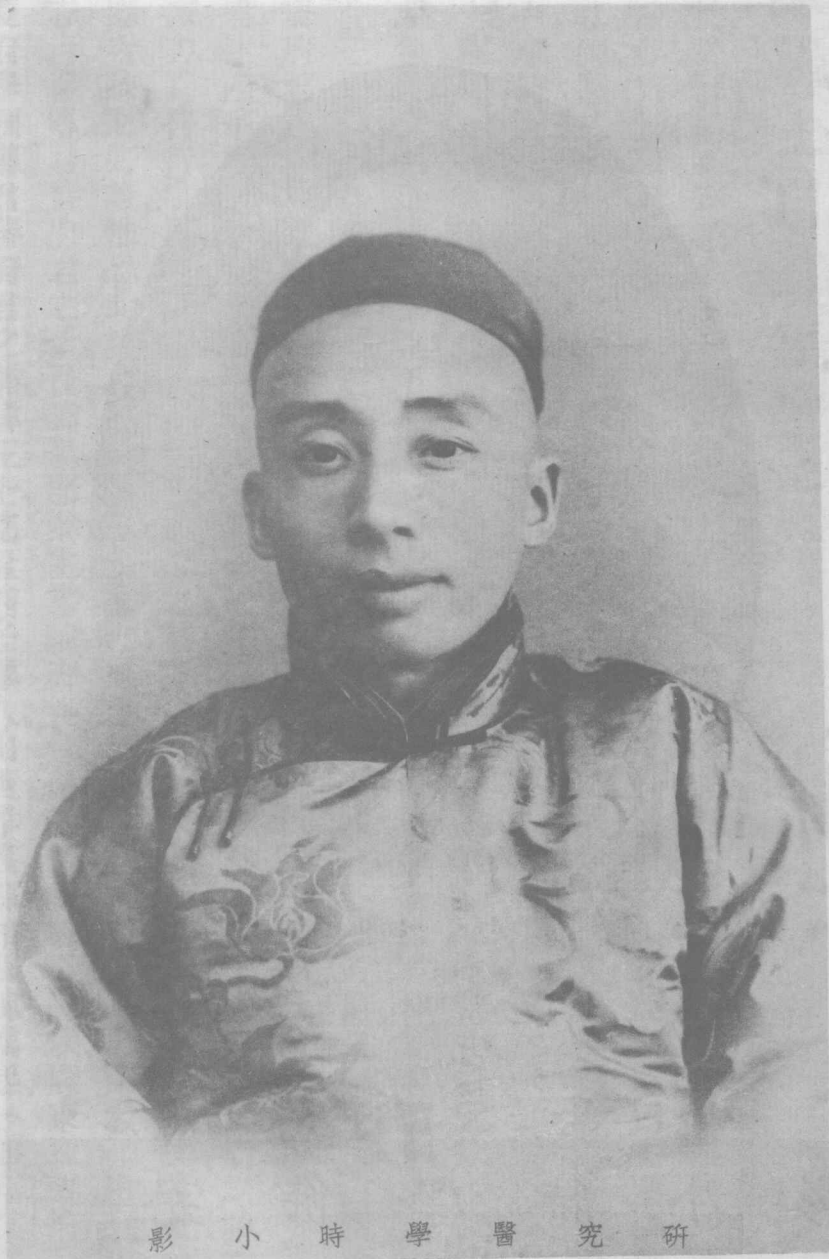
影 小 時 學 醫 究 研