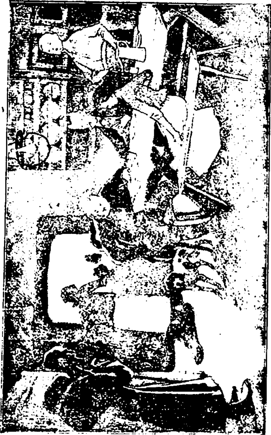
Ибыл тасымда аи рукой ўзармаўся ў грудан.