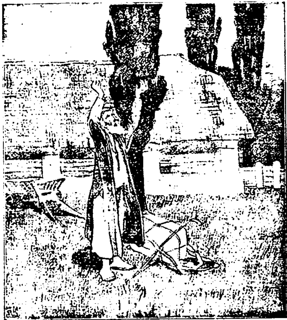
Гэдали адмаўляю пачорную матыцу.

Крыху потым лежаў наўзніч, маючы пад галавой пакунак, раскінуўшы рукі на мокрай траве. Здалёк, з поля, чутны быў