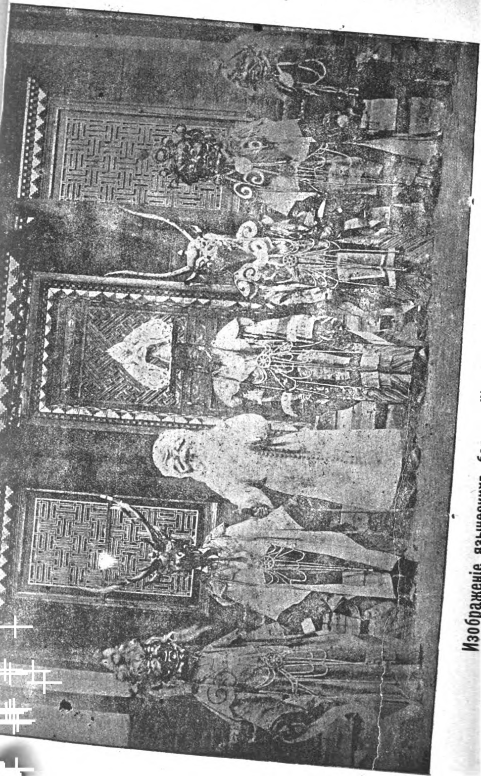
Изображеніе языческихъ боговъ (ИДолы) буддистскаго культа.