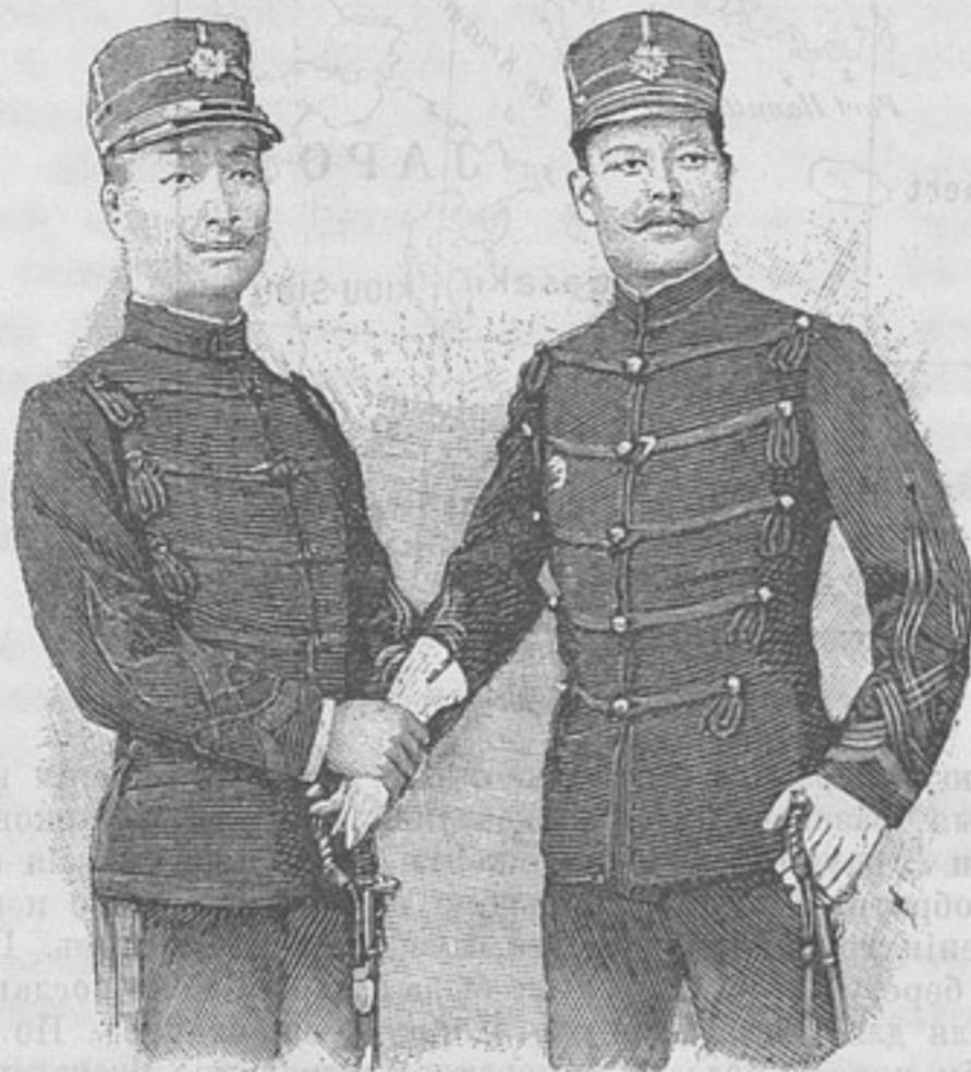
Японскій офицеръ въ полной формѣ.

даже имѣли успѣхъ въ наступательныхъ дѣйствіяхъ противъ правительства. Нападенія производились преимущественно на префектуры, въ которыхъ чиновники своими поступками наиболѣе отвратили отъ себя мѣстное населеніе, а захваченные склады доставили запасы для веденія борьбы на будущее время. Народныя симпатіи, уже возбужденныя предполагаемою правотою дѣла инсургентовъ, усилились, благодаря великодушію послѣднихъ по отношенію къ нуждающимся и страждущимъ. Въ отношеніи же правительственныхъ войскъ случилось какъ разъ наоборотъ, ибо они, вслѣдствіе скудости снабженія, должны были жить на средства страны, чѣмъ, конечно, возбуждали неудовольствіе жителей. Сначала правительство предписало мѣстной администраціи бороться съ возставшими, но затѣмъ, видя неуспѣшность ея борьбы, отправило на мѣсто дѣйствій отрядъ войскъ (около 1,000 человекъ пѣхоты, вооруженной