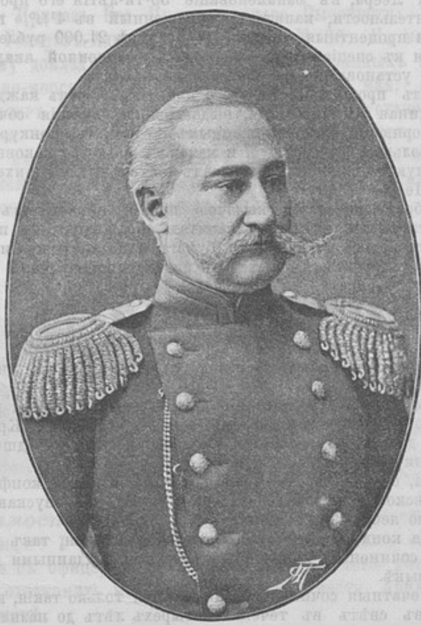
Начальникъ 6-й бригады Навалерійскаго запаса, Генераль-Маіоръ

Родился въ 1839 г. Воспитывался первоначально въ Пе-