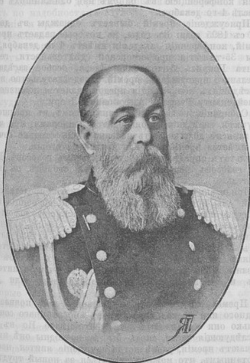
Начальникъ 60-й пѣхотной резервной бригады, Генераль-Маіоръ

Денги могутъ быть высланы почтовыми марками, каждая не дороже 50 к. Безденежная подписка не принимается. За перемѣну адреса 28 к. Отдѣльные №№ выслаются за 15 к. Объявленія принимаются по особой расцѣнкѣ, выслаемой по требованію.