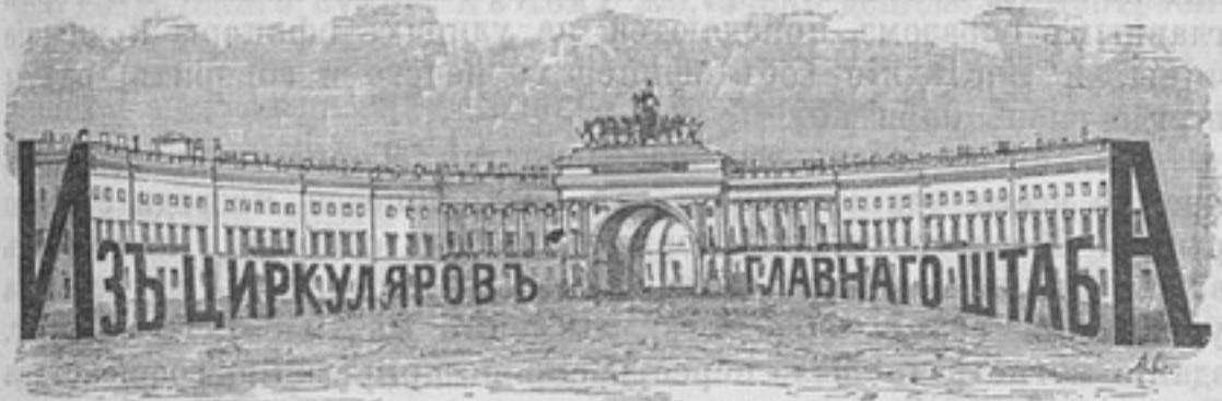
Копія съ циркуляра департамента желѣзнодорожныхъ дѣлъ вѣстмъ правленіямъ желѣзнодорожныхъ обществъ отъ 4-го іюля 1894 года № 5188/1893.

Июля 19-го дня, № 157. Государь Императоръ повелѣть соизволилъ: наименовать мѣстность близъ г. Остроленки, въ коей расположены казармы: 16-го драгунскаго Глуховскаго Ея Императорскаго Высочества Великой Княгини Александры Іосифовны полка, 10-го сапернаго баталіона и частей 21-го Муромскаго и 22-го Нижегородскаго Ея Императорскаго Высочества Великой Княгини Вѣры Константиновны пѣхотныхъ полковъ — « Нижегородскимъ штабомъ », а мѣстность у г. Млавы, занятую казармами 18-го драгунскаго Клястицкаго Его Королевскаго Высочества Великаго Герцога Гессенскаго Эрнста-Людвига полка — « Кульневскимъ штабомъ ».