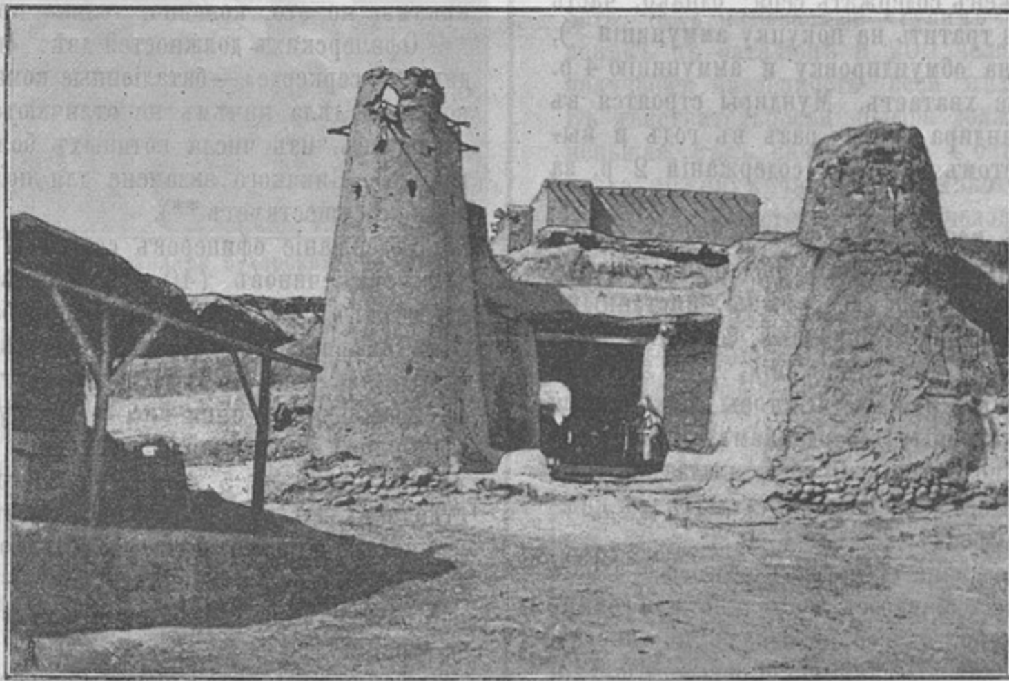
Ворота цитадели въ г. Бальджуанъ.

Нѣтъ пока основанія ожидать самостоятельнаго возрожденія бухарскаго народа, а слѣдовательно и созданія сильной бухарской арміи; явившись среди его племенъ и кликнувъ кличь, можно, подобно атаманамъ былыхъ вѣковъ, собрать сотню, другую лихихъ джигитовъ — готовыхъ на все головорѣзовъ, — но не у такого народа, да и не на почвѣ восточнаго деспотизма вообще, создается войско на началахъ общей воинской повинности и живущее принципами дисциплины европейскихъ армій. Однако, возразятъ намъ, можетъ быть, есть другой принципъ, способный сплотить ряды сарбазовъ? Допуская даже возможность его существованія, нельзя не