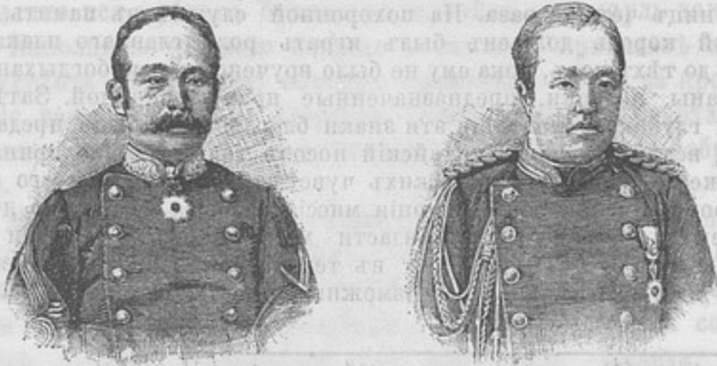
Офицеръ японскаго генеральнаго штаба (въ полной формѣ).

административными лицами, прибѣгающими ко всевозможнымъ средствамъ для обогащенія себя на счетъ народа, и такъ какъ суда искать негдѣ, то рекомендуется взяться за оружіе. За послѣдніе три года мѣстные возстанія случались повсюду въ Корей, но правительство было слѣпо къ этимъ предзнаменованіямъ предстоящей опасности и продолжало свою самоубійственную политику. Въ теченіе послѣднихъ пяти мѣсяцевъ южная провинція Чуллу была неспокойна; всюду замѣчалось броженіе: крестьяне и фермеры собирались на сходки въ опредѣленные центры, а мѣстные мандарины не были въ состояніи разгонять эти сборища. Изъ правительственныхъ складовъ начало пропадать оружіе и разные запасы. Приверженцы партіи, снабженные такимъ образомъ оружіемъ, не только успѣшно сопротивлялись всѣмъ усиленіямъ подавить революціонное движеніе, но