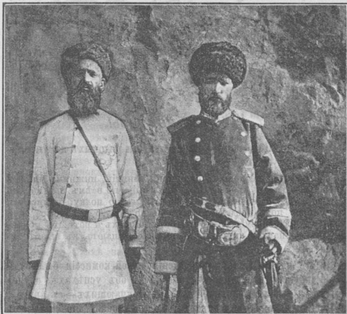
Типы ротнаго и баталіоннаго командира бухарскихъ войскъ.

вавшего въ теченіе 4-хъ вѣковъ до середины нынѣшняго столѣтія. Въ началѣ XIX столѣтія усилившіяся войны между Бухарой и Персіей, ея неконнымъ Иранскимъ врагомъ, вынудили эмировъ отказаться отъ слѣдоваго слѣдованія въ дѣлѣ организаціи войскъ образцу Тимура, полчища котораго состояли исключительно изъ конницы. Эмиръ Шахмурадъ первый завелъ полевую артиллерію и весьма ограниченное число пѣхоты.