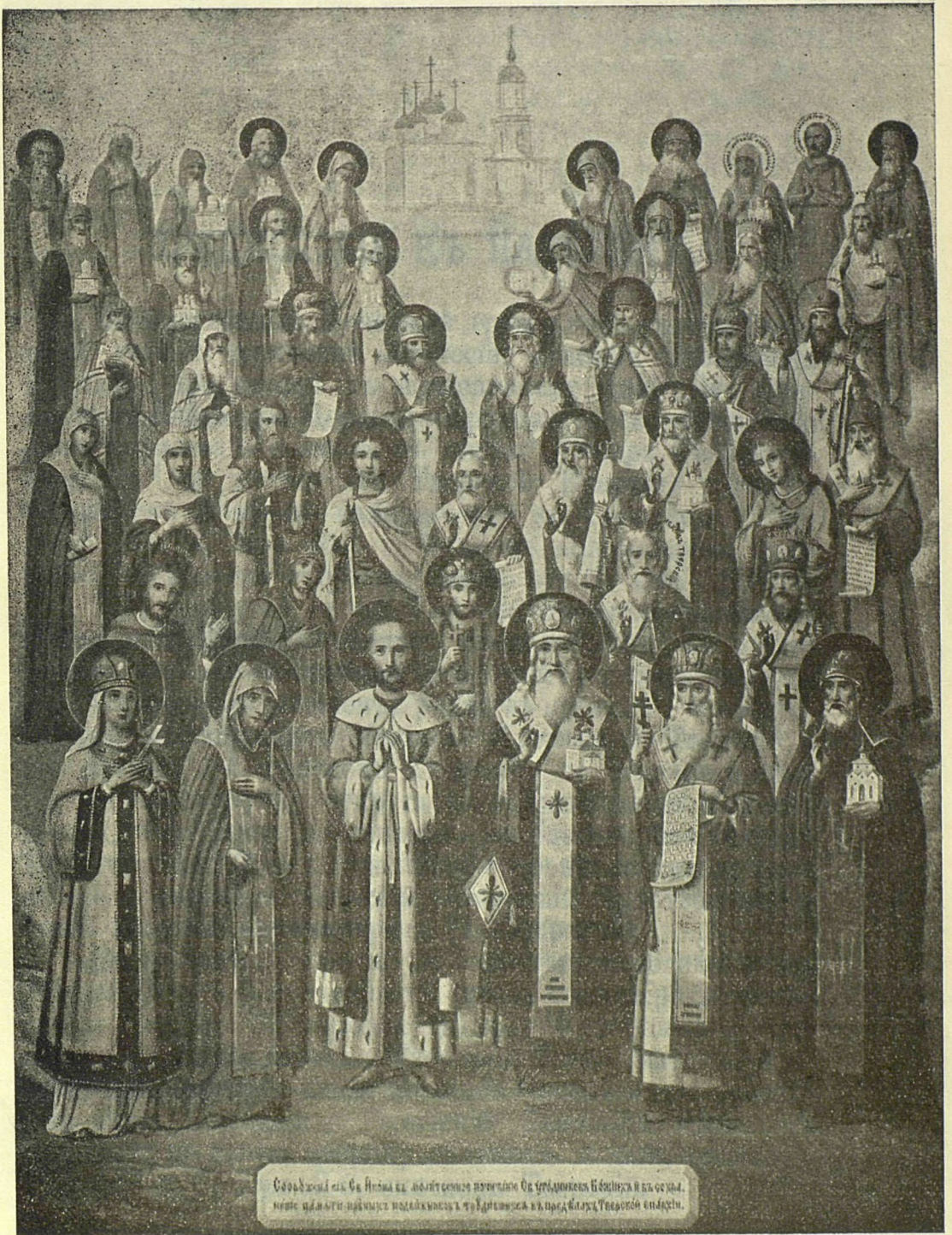
Собрание св. Св. Троицы св. святителей и священников св. соборных епископов и св. ермитахов, принесших пять священных подаяний св. Троице в г. под властью Троицею епископа.