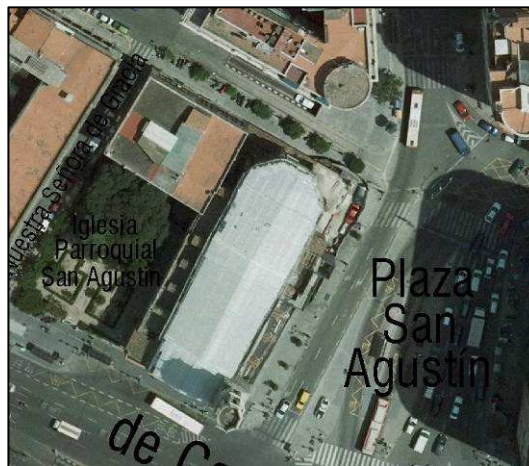
Fotografía Aérea 2008

Cartografía Catastral: YJ2752C Manzana: 54223 Parcela: 01(Parte) CART. CATASTRAL: 423-1-I / II / III / IV IMPLANTACIÓN: MANZANA AISLADA FORMA: REGULAR SUPERFICIE: 1254,86 M2