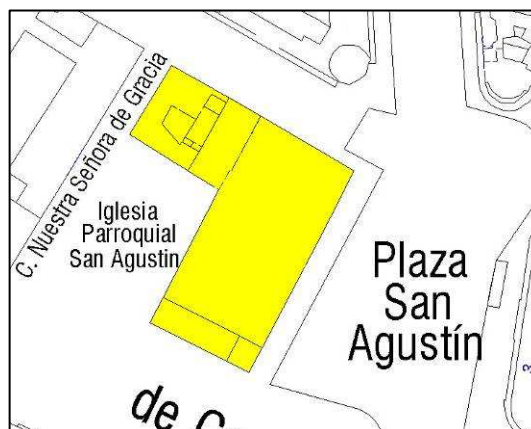
Parcelario Municipal 2008

NÚMERO DE EDIFICIOS: 1 NÚMERO DE PLANTAS: 1 OCUPACIÓN: TOTAL CONSERVACIÓN: BUENO