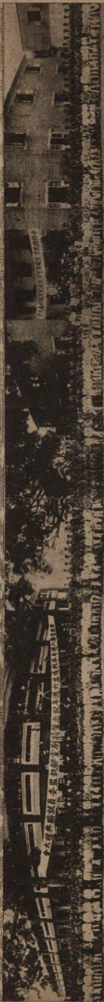
■ 影攝禮典職員委監執部黨別特年週六技本浦黃