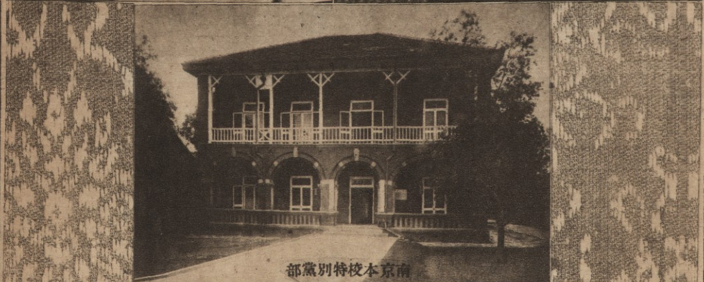
北京本校特別支部