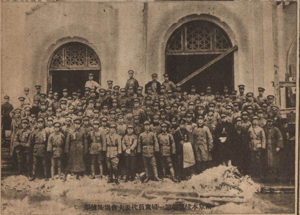
北京本校第一屆黨員代表大會情形