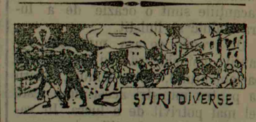
Crime — Delicte. — Accidente. — Intîmplări.