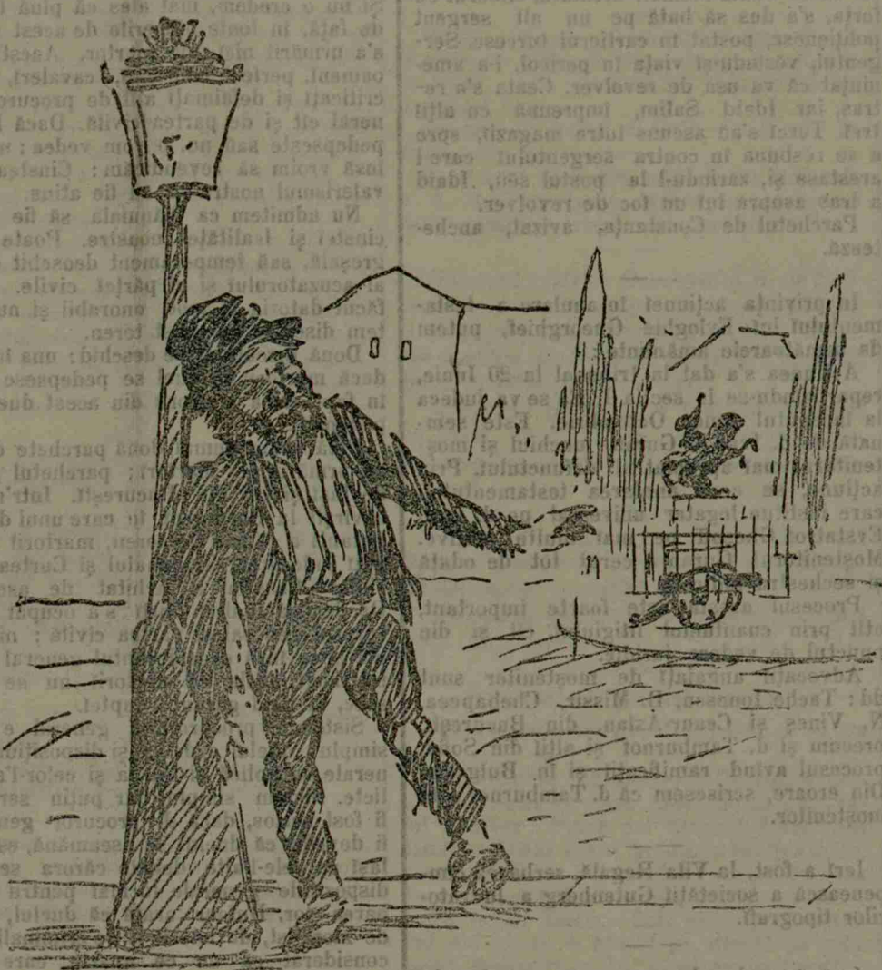
— Și eu sunt tun!...