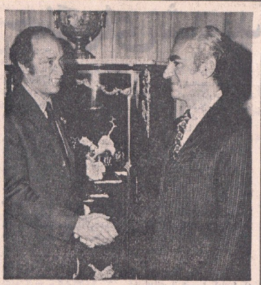
شاهنشاه آریامهر «الویتخود» نخست وزیر ۱۱ ساله کانادا را دیروز در کاخ نیاوران بحضور پذیرفتند. در صفحه ۴

سفته آزمایشی فرمانده ایپولو ۱۴ سقوط کرد و منقرض شد سر نشینان ایپولو ۱۴ در ناهموارترین نقاط کره ماه فرود می آیند فضانوردان ایپولو ۱۴ عمر کره ماه را تعیین میکنند اگر ترمز های مدول ماه نشین نگیرد، سفته با فضانوردان در کره ماه متلاشی میشود. نیکسون در آستانه پرواز ایپولو ۱۴ بودجه فضایی آمریکا را تقلیل داد. در صفحات ۹۳ و ۹۴