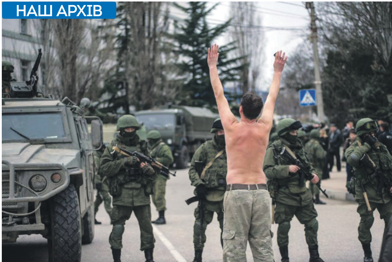
На жаль, Росія таки пішла на конфронтацію з усім світовим співтовариством й анексувала Крим... 2014 рік, військова частина морських прикордонників у Балаклаві