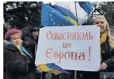
«Євромайдан-Крим» у Севастополі

4 ГРУДНЯ 2013 Р. – у Сімферополі відбулася акція «Йолка для Януковича»; того ж дня було ство-