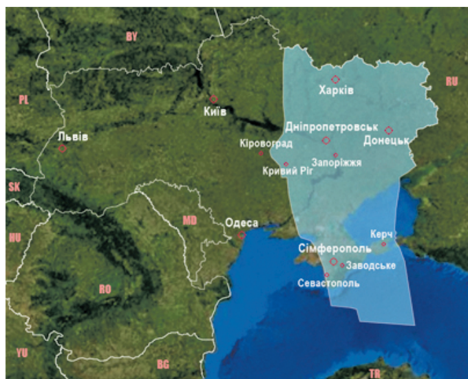
Зона контролю повітряного руху м. Дніпро

Демонструючи нехтування всіма цивілізованими нормами, плекаючи ілюзії своєї «особливості» у світі, Росія вкотре прирікає себе на новий етап деградації. Можна літати, сподіваючись на російський «авось», можна навіть «виграти» світову першість з допінгу, можна роками видавати брехню через слухняні ЗМІ. Але таке ми вже проходили. Це закінчується чорнобилями, «нахімовими» і «курськими», паралічем економіки, що нічого ліквідного на світовому ринку, крім нафти й газу, запропонувати не може, а в підсумку – системою кризою, банкрутством держави та розпадом країни.