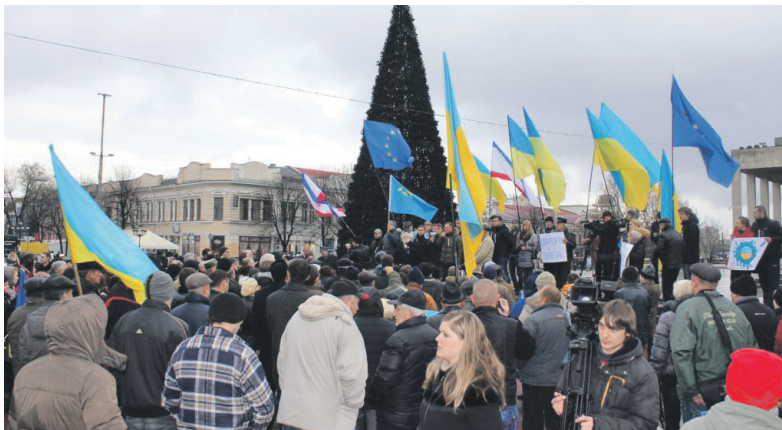
Мітинг «Євромайдан-Крим», 7 грудня 2013 року.

3 ГРУДНЯ 2013 Р. – уночі було здійснено підпал дерев'яного Хрестовоздвиженського храму УПЦ КП в Євпаторії. У Сімферополі відбулося засідання президії ВР АРК, на якому обговорювалася політична ситуація в країні, під час якого перший віце-спікер Сергій Донич обізвав євромайданівців «непотребом». Депутат фракції Партії регіонів Володимир Кличніков заявив про необ-