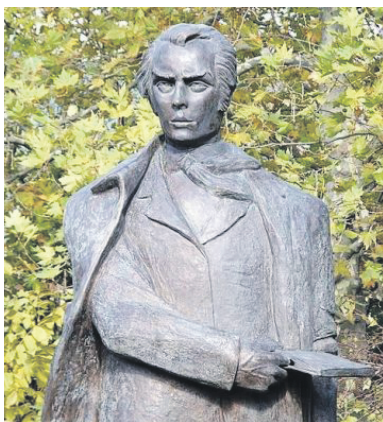
Пам'ятник Тарасу Шевченку в Ялті

хідність відстежування «ініціаторів націоналістичного спрямування», заявивши, що визначити їх не важко, тому що «найчастіше більшість з них жодного слова російською не знають», і запропонував парламенту звернутися до Міністерства юстиції АРК щодо розгляду питання про заборону на території півострова діяльності ВО «Свобода».