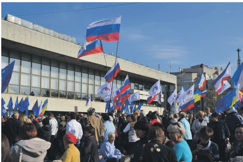
Провладний мітинг «Кримчани – за мир та стабільність в Україні»