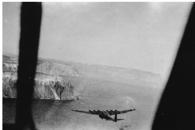
Німецький військово-транспортний літак над Чорним морем

ту, призвали до лав Вермахту, ніхто не питав, чи має він бажання йти воювати. З 1939 року Генріх Белль – солдат Другої світової війни.