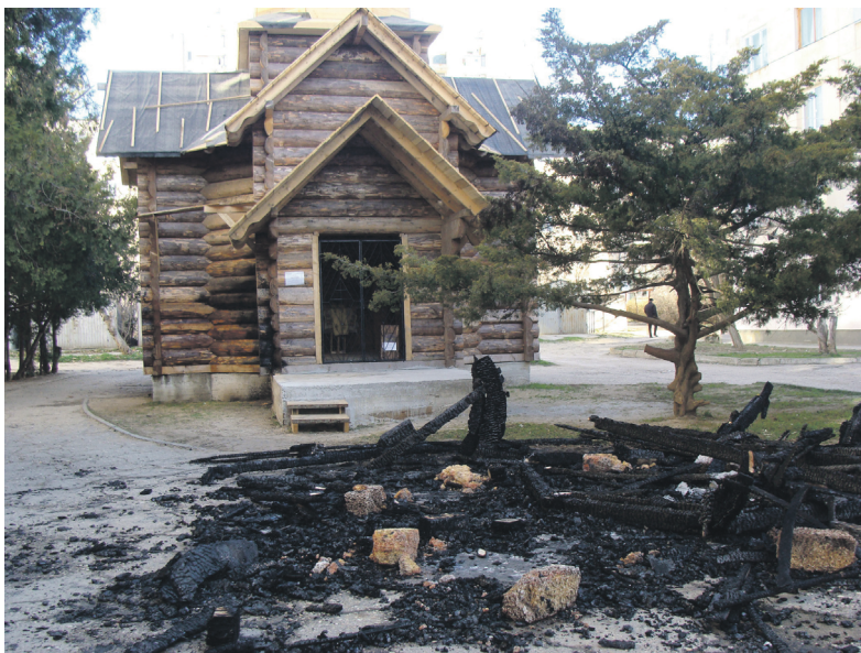
Підпалений дерев'яний Хрестовоздвиженський храм УПЦ КП в Євпаторії