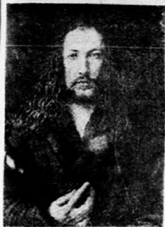
(阿爾布累希特自畫像)

在美國西北大學的一個小禮拜堂我們可以看到一個兩隻手的彫像；那兩隻手是在作着祈禱的樣子。當然這是一個很簡單的彫像，不過其中却有一個特別的故事。