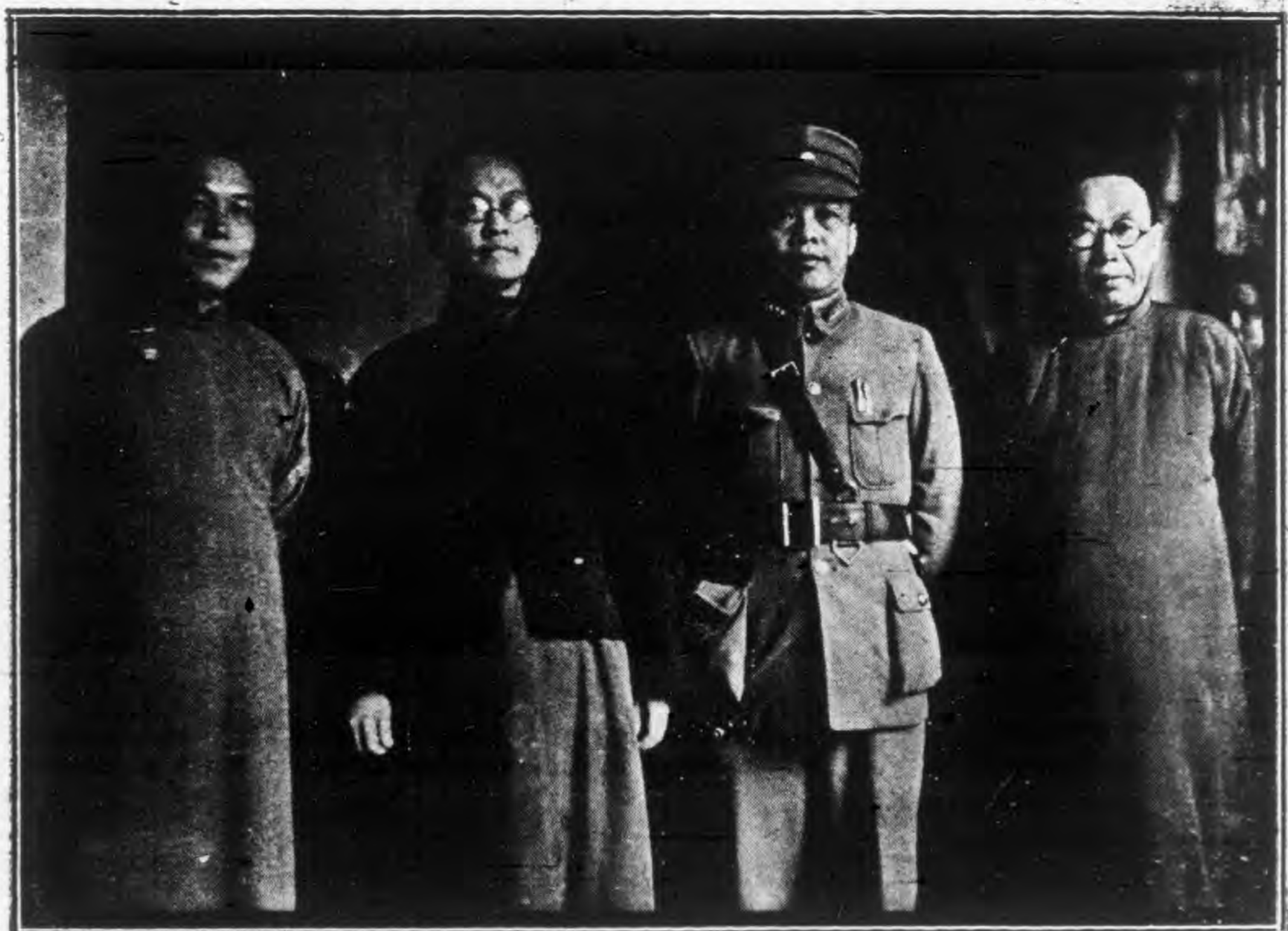
—影合等令司總陳與粵抵氏民漢胡席主會常中