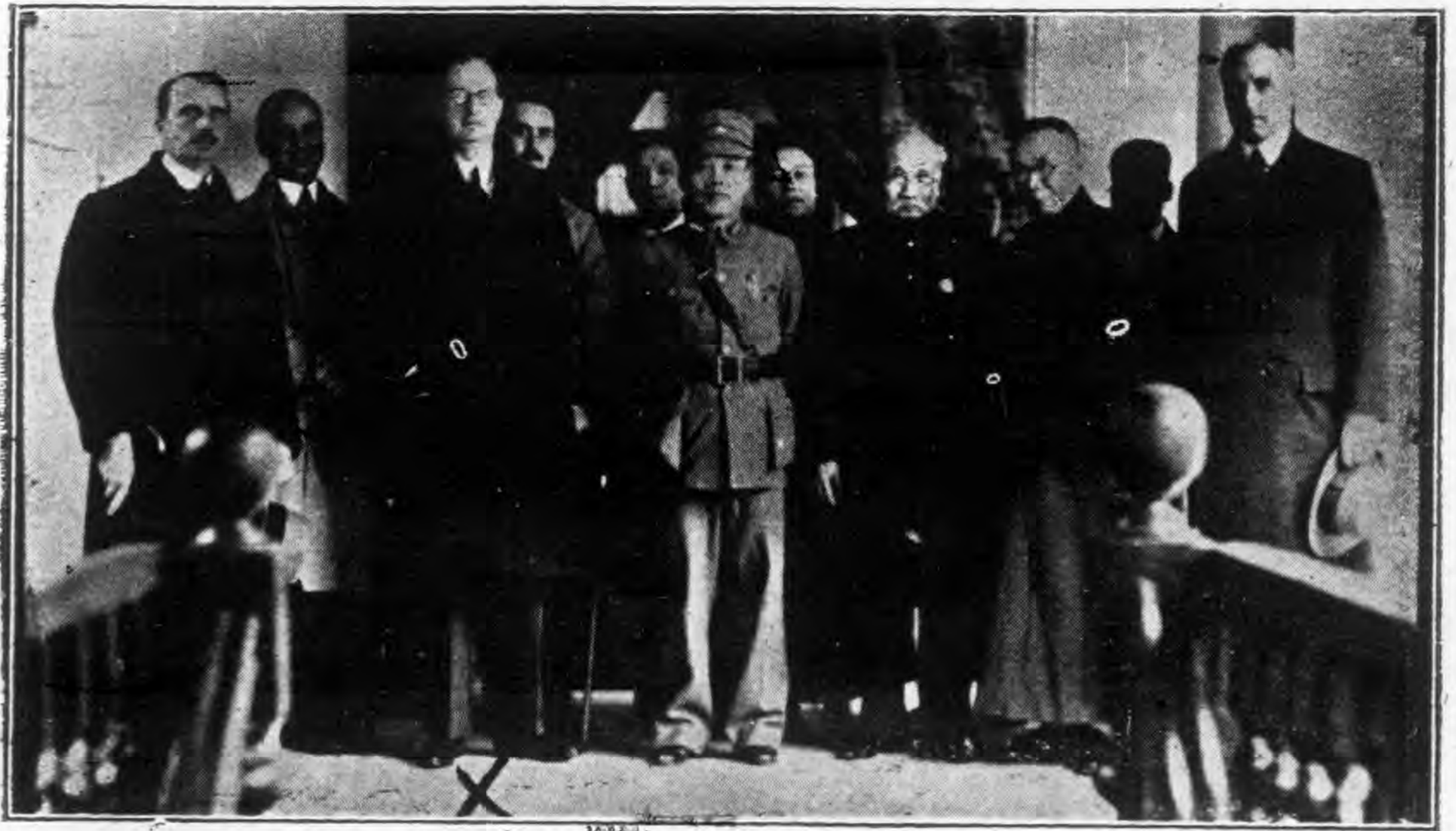
(一) 英 國 財 政 部 顧 問 李 滋 羅 斯 抵 粵