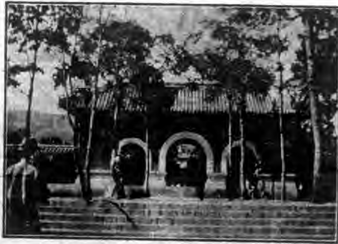
北伐陣亡將士公墓之門