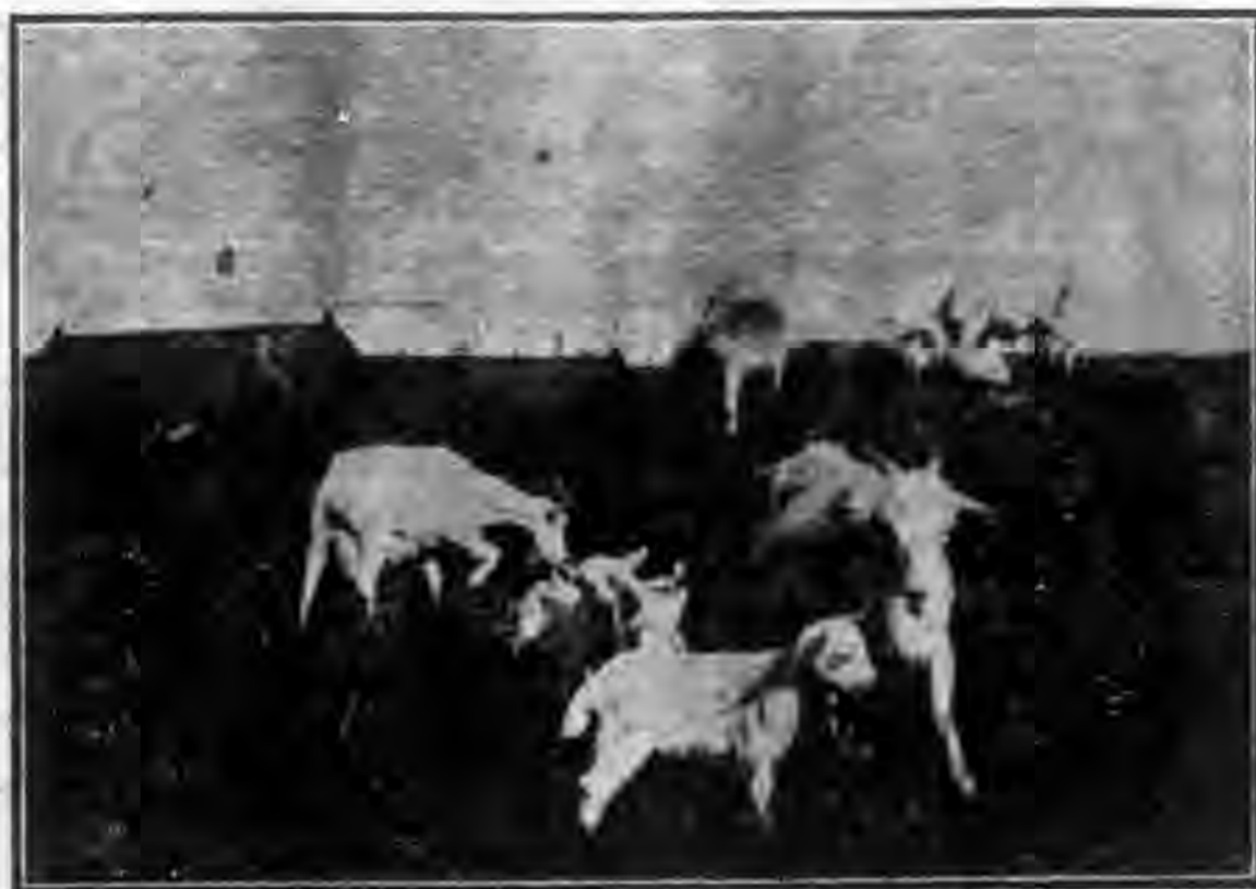
金陵大後坡之羔羊