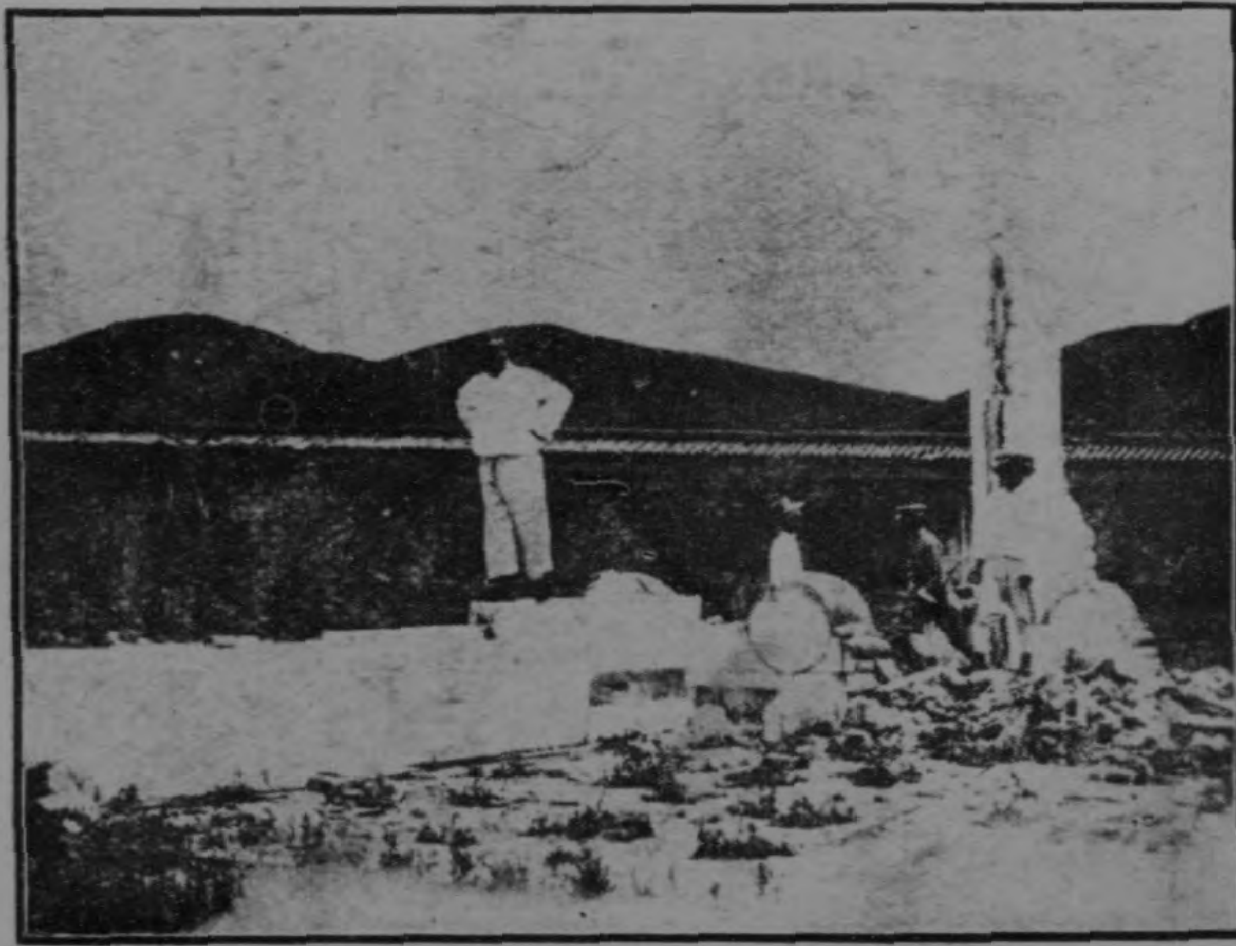
乾 隆 陵 被 毀 之 二