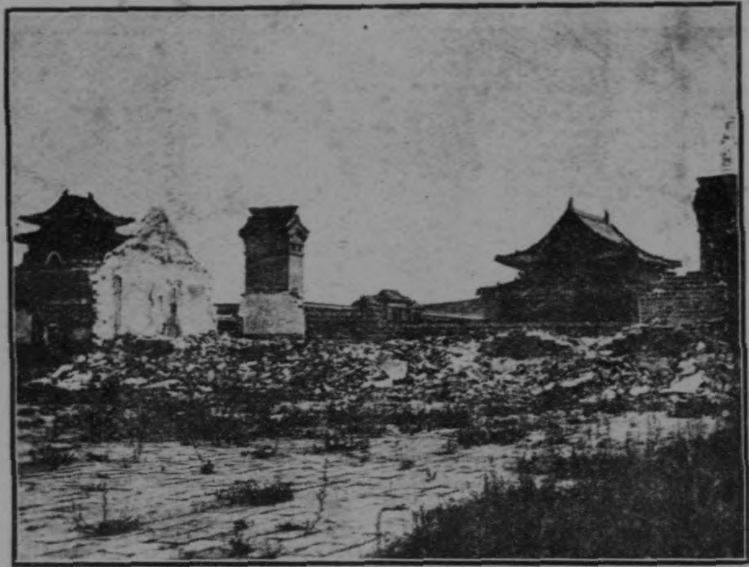
乾 隆 陵 被 毀 之 一