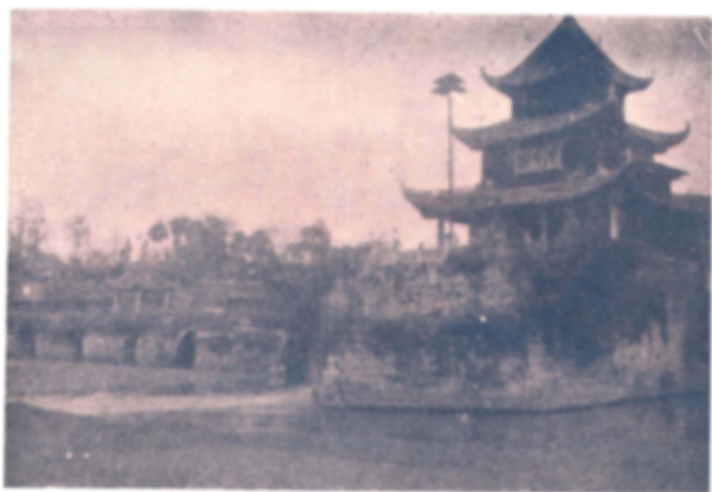
(橋玉浮即左) 樓秀甲