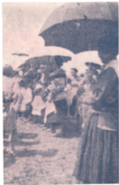
苗女至月場列爲一排