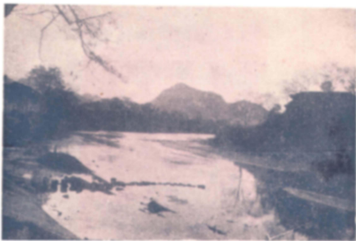
(關微翠右 館會義興左) 山嶽南望遠河明南由