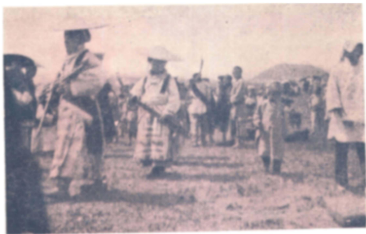
場月赴正笙蘆持手民苗