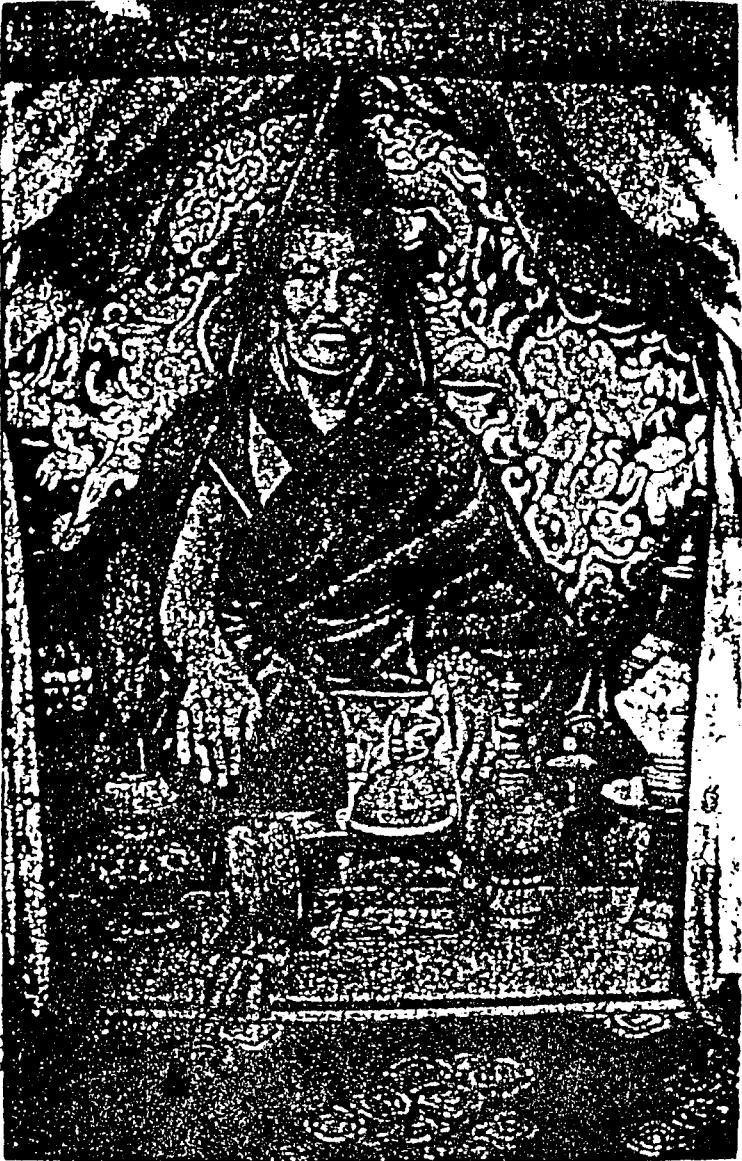
尼德爾額禪班師大慧廣化宜國護