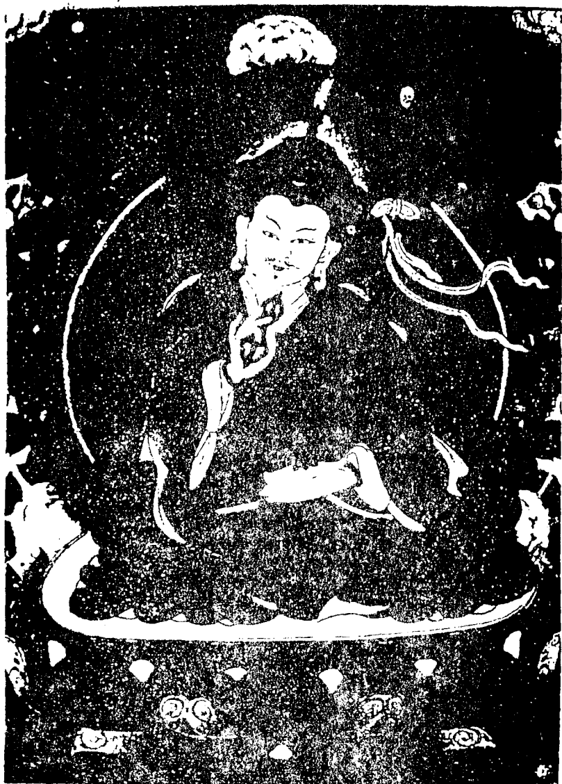
紅 教 祖 師 蓮 華