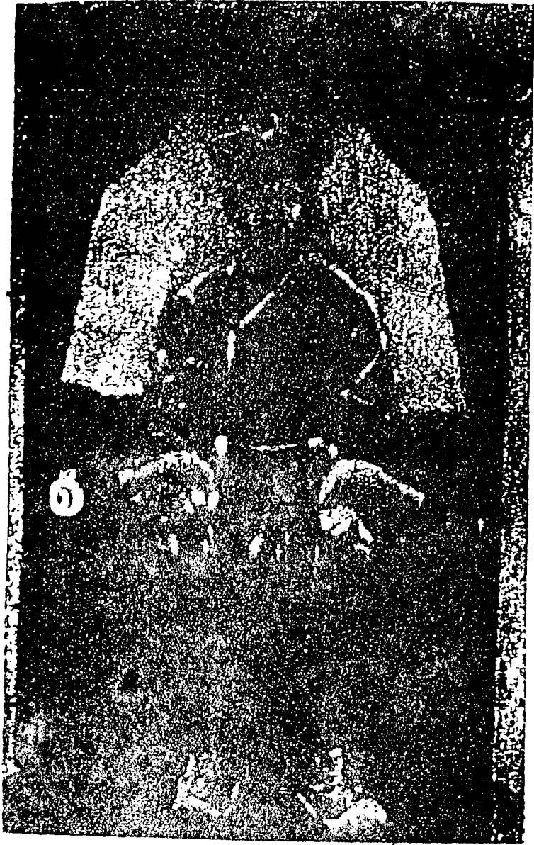
外蒙善輔化博多克哲布丹呼圖克圖