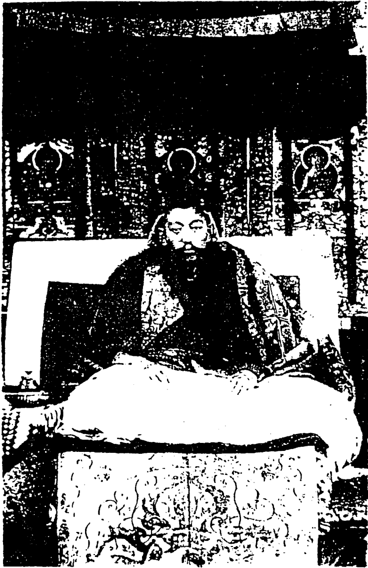
喇 喇 賴 達 師 大 覺 圓 慈 普 化 宏 國 護