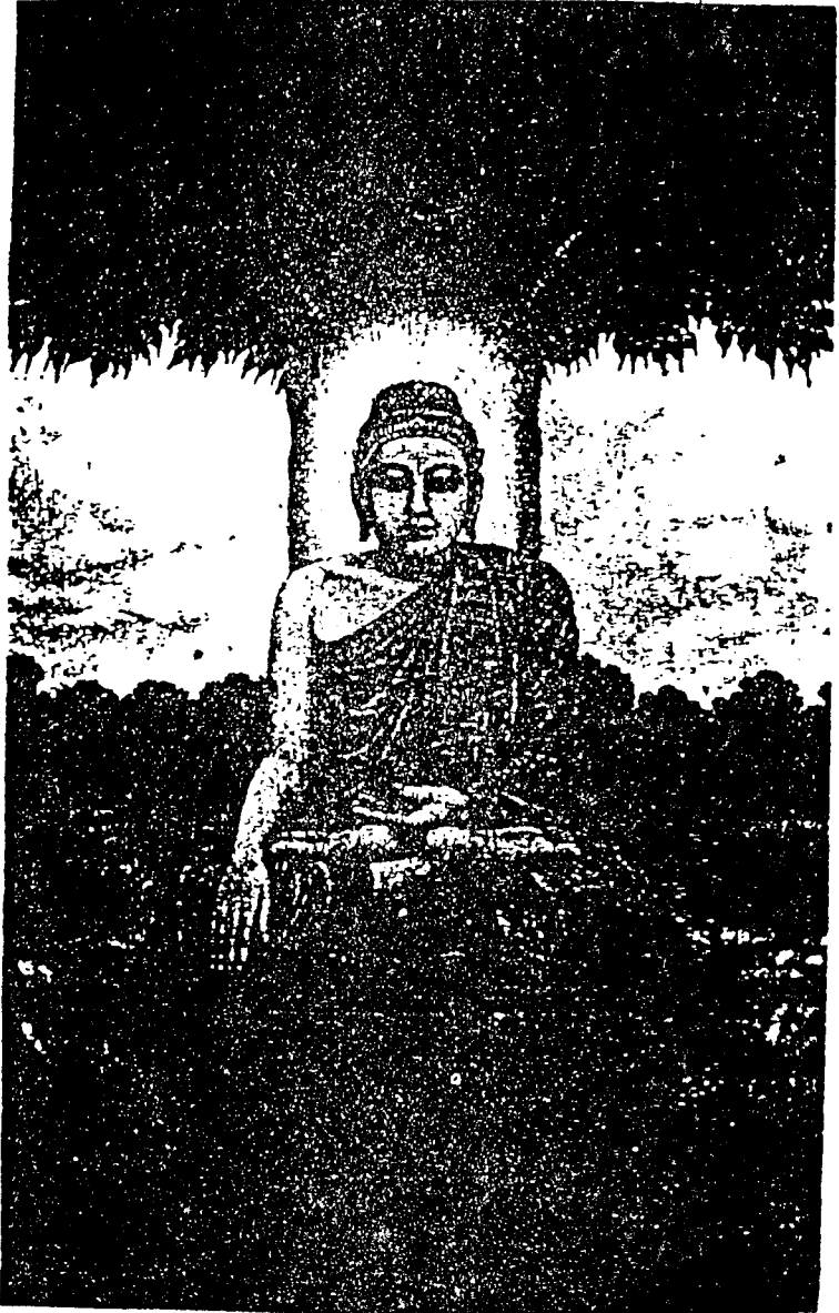
佛 尼 牟 迦 釋