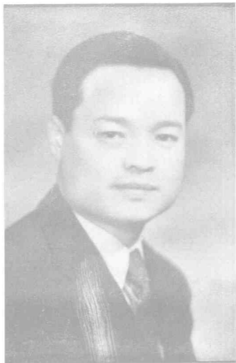
社會局局長雷嗣尙