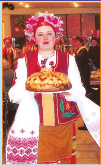
Материнський коровай.