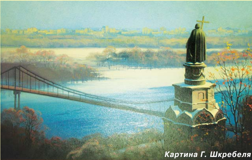
Картина Г. Шкребеля

нищення всього господарського комплексу, на працьованого століттями й перетвореного в народну традицію, призвело до неперворотних процесів деградації Духа, міна сповільненої дії, поставлена в Україні ще "реформаторами" Петра I й Катерини II, які знищили монолітність козацького народу, почавши розселяти на наших землях спритників із різних позамежних країв, спрацьовує в царині міжнародних стосунків, а корінний народ тільки змороно мовчить та чухає вихудлі потилиці. Маємо те, що маємо – так вирік ще на початку нашої незалежності перший офіційний президент. Так, прапори держави майорять гордо лише тоді, коли під ними