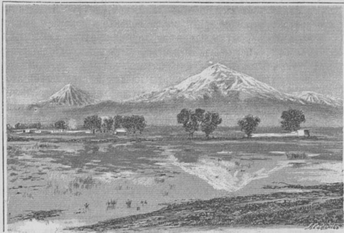
Большой и Малый Араратъ.

Не взирая на то, что многіе посты расположены на высотахъ въ 6,000—7,000 футъ и болѣе, при чемъ они раздѣлены глубокими, едва проходимыми, щелями, тущогами, крутыми скатами, которые болѣе 6 мѣсяцевъ покрыты глубокими снѣгами, на постахъ ежедневно отправлялась сторожевая служба, и бдительный надзоръ за границею не прекращался и въ суровую зиму, особенно на тѣхъ постахъ, которые находятся вблизи курдскихъ зимовниковъ.