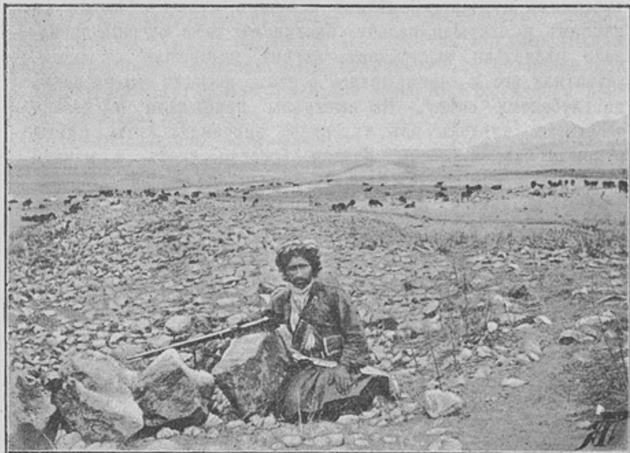
Курдъ-Джелалинецъ, охраняющій свое стадо.

Казаки Тандурекскаго поста, услышавъ выстрѣлы, направились къ пункту перестрѣлки. Скакать верхомъ нельзя было: лежалъ глубокій снѣгъ, который также не позволялъ имъ быстро подниматься въ гору и пѣшкомъ. Все-таки постъ успѣлъ оказать своевременную выручку своему пикету. Замѣтивъ движеніе казаковъ съ поста, курды перестали насѣдать, а черезъ нѣкоторое время повернули назадъ, захвативъ съ собою одного убитого и двухъ раненыхъ.