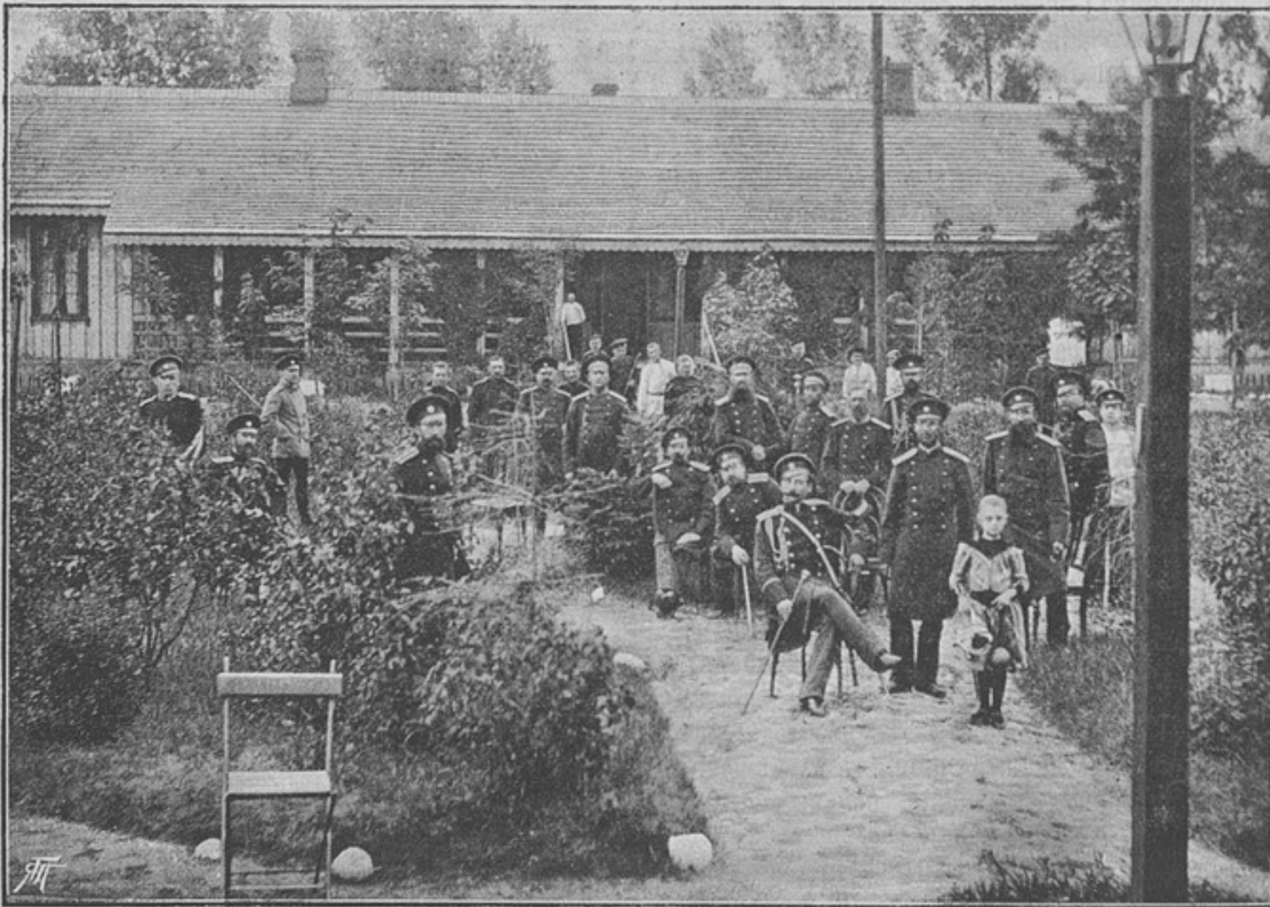
Офицерскій баракъ Цѣхоцинской санитарной станціи.