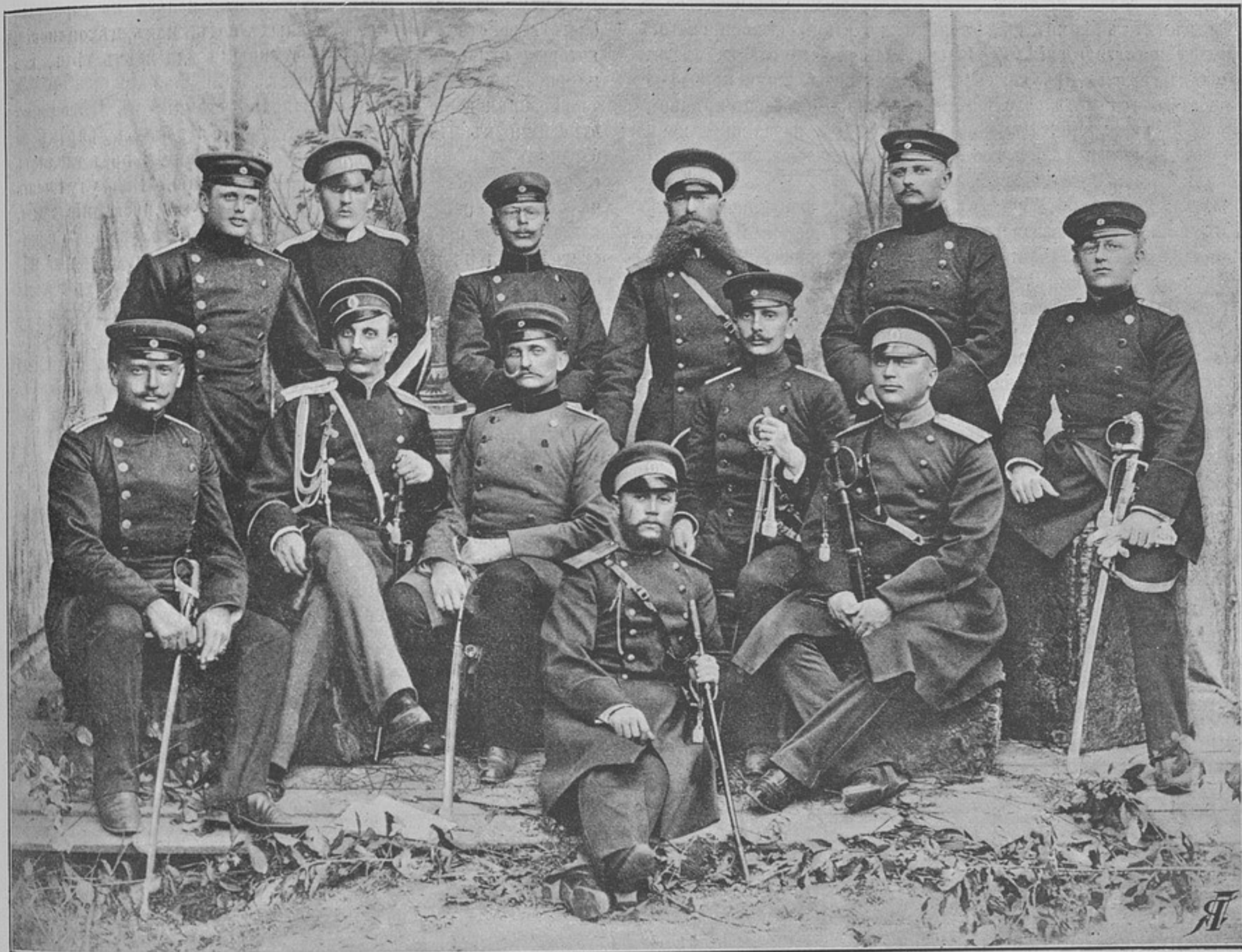
Прусскіе офицеры Торнскаго гарнизона въ гостяхъ у русскихъ камадровъ (сотоварищей) въ Цѣхоцинкѣ.

начальника 8-й мѣстной бригады, генераль-маіора Д. Д. Кожухова, которому удалось собрать отъ разныхъ войсковыхъ частей и управленій воинскихъ начальниковъ, равно какъ отъ нѣкоторыхъ частныхъ лицъ, необходимую сумму въ 1592 р. 44 к. Богослуженіе въ этой церкви совершаетъ одинъ изъ полковыхъ священниковъ, ежегодно командируемый по распоряженію военнаго начальства на время лѣчебнаго сезона въ Цѣхоциноукъ. Ее посѣщаютъ, кромѣ офицеровъ и нижнихъ чиновъ станціи, также и всѣ русскіе люди, проводящіе здѣсь лѣто. Понятно, что подъ церковнымъ наметомъ можетъ помѣститься лишь десятая часть всѣхъ молящихся, при чемъ остальные находятся подъ открытымъ небомъ, что не совсѣмъ то удобно во время дождя или жары. Обыкновенно при церкви образуется каждое лѣто довольно порядочный хоръ пѣвчихъ, состоящій изъ любителей церковнаго пѣнія и нижнихъ чиновъ, бывшихъ въ частяхъ пѣвчими.