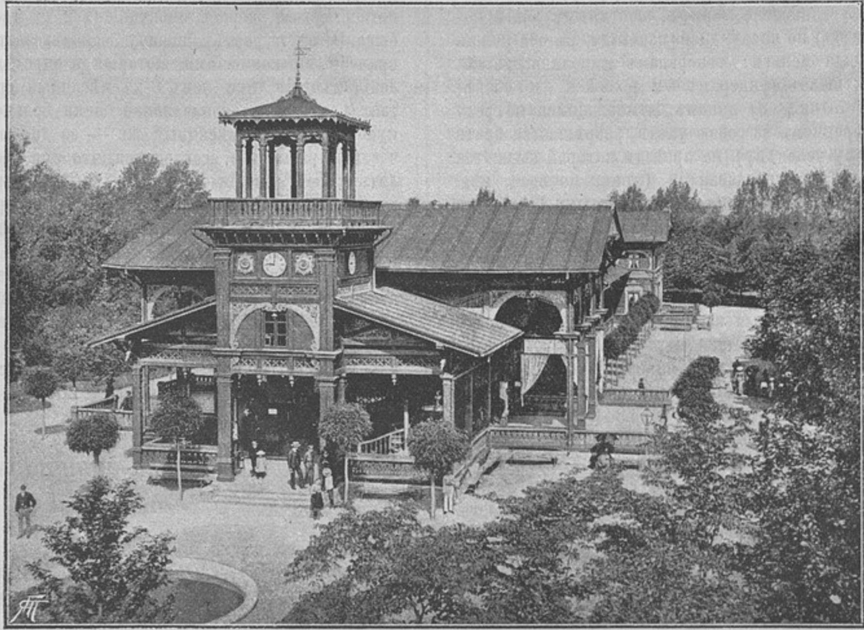
Прогулочная галлерей въ Цѣхоцинскомъ паркѣ.

вычайно способствующій украшенію этой части парка. Солянку пьютъ, обыкновенно, по утрамъ, отъ 7-ми до 10-ти часовъ. Куреніе папирозъ и сигаръ въ это время въ прогулочной галлерей запрещается. Прогулочная галлерей