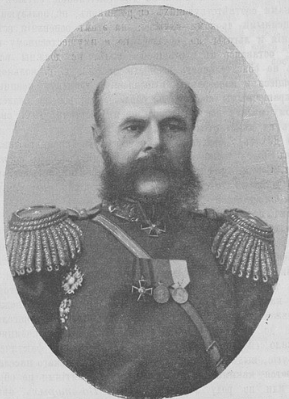
Начальникъ 11-й пѣхотной дивизіи, генераль-лейтенантъ Эдмундъ-Леопольдъ Фердинандовичъ СВИДЗИНСКІЙ.

СОДЕРЖАНІЕ: Портретъ генераль-лейтенанта Эдмунда-Леопольда Фердинандовича Свидзинскаго. — С.-Петербургъ 17-го февраля.—Распоряженія по военному вѣдомству. — Хроника. — Армейскія замѣтки. И. Ночинъ. — Дисциплина и инициатива. А. Зиковъ. — Хамству не мѣсто въ арміи. Ив. Рябцовъ. — Упрощеніе необходимо. Г. Елчаниновъ. Къ унтеръ-офицерскому вопросу. Подпрапорщикъ. — Обзоръ печати. — Иностранная армія. — Библиографія. — Фельетонъ. Объявленія. — Высочайшіе приказы.