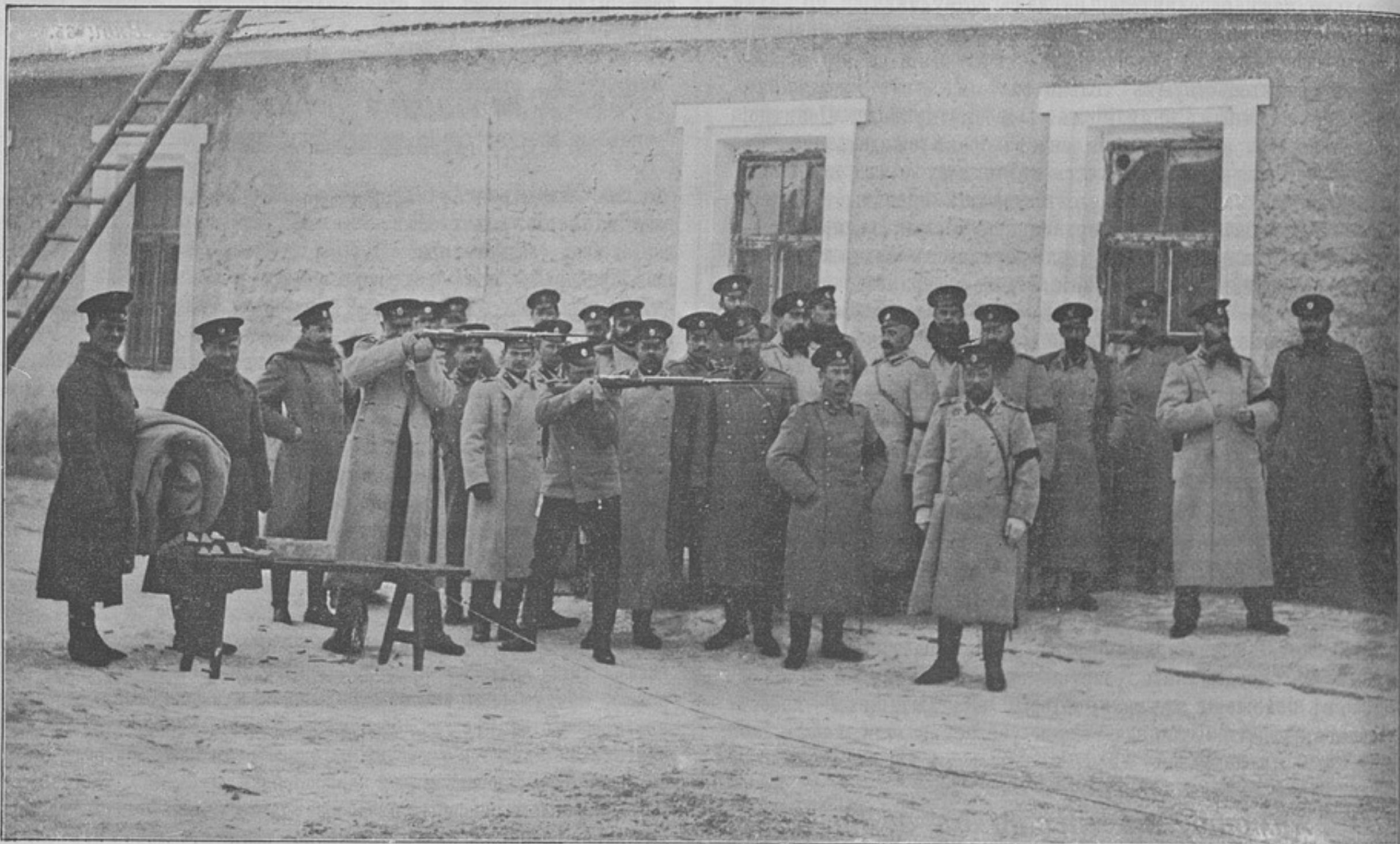
Стрѣльба гг. офицеровъ. (Къ кор. «Могилевъ-Подольскій»).

вальные въ лагерѣ, а кто то изъ палатокъ 2 баталіона кричитъ «съ лопатками». Такъ раздалось въ одинъ изъ тѣхъ немногихъ жаркихъ дней нынѣшняго лѣта въ лагерѣ N—скаго пѣхотнаго полка, расположеннаго на Юго-Западѣ Россіи, въ уѣздномъ городѣ К. Черезъ 2—3 минуты послышалось топаніе бѣгущихъ ногъ и бряканіе полвязываемыхъ на ходу шашекъ; побѣжали вызываемые фельдфебеля спрашивая другъ у друга—кто звалъ, зачѣмъ? Черезъ 4—5 минутъ всѣ были уже выстроены передъ серединой лагернаго расположенія полка въ ожиданіи появленія вызывавшаго. Вскорѣ вышелъ изъ караульной палатки распекавшій за что то караульнаго начальника подполковникъ П., завѣдывающій хозяйствомъ; съ праваго фланга раздалась команда «смирно»; всѣ вытянувшись въ струнку взяли подъ козырекъ.—«Мужики, жида, хамы! а квасъ задѣланъ? черезъ двѣ недѣли смотрѣ начальника дивизіи, а я черезъ васъ, сволочей, краснѣть буду!»