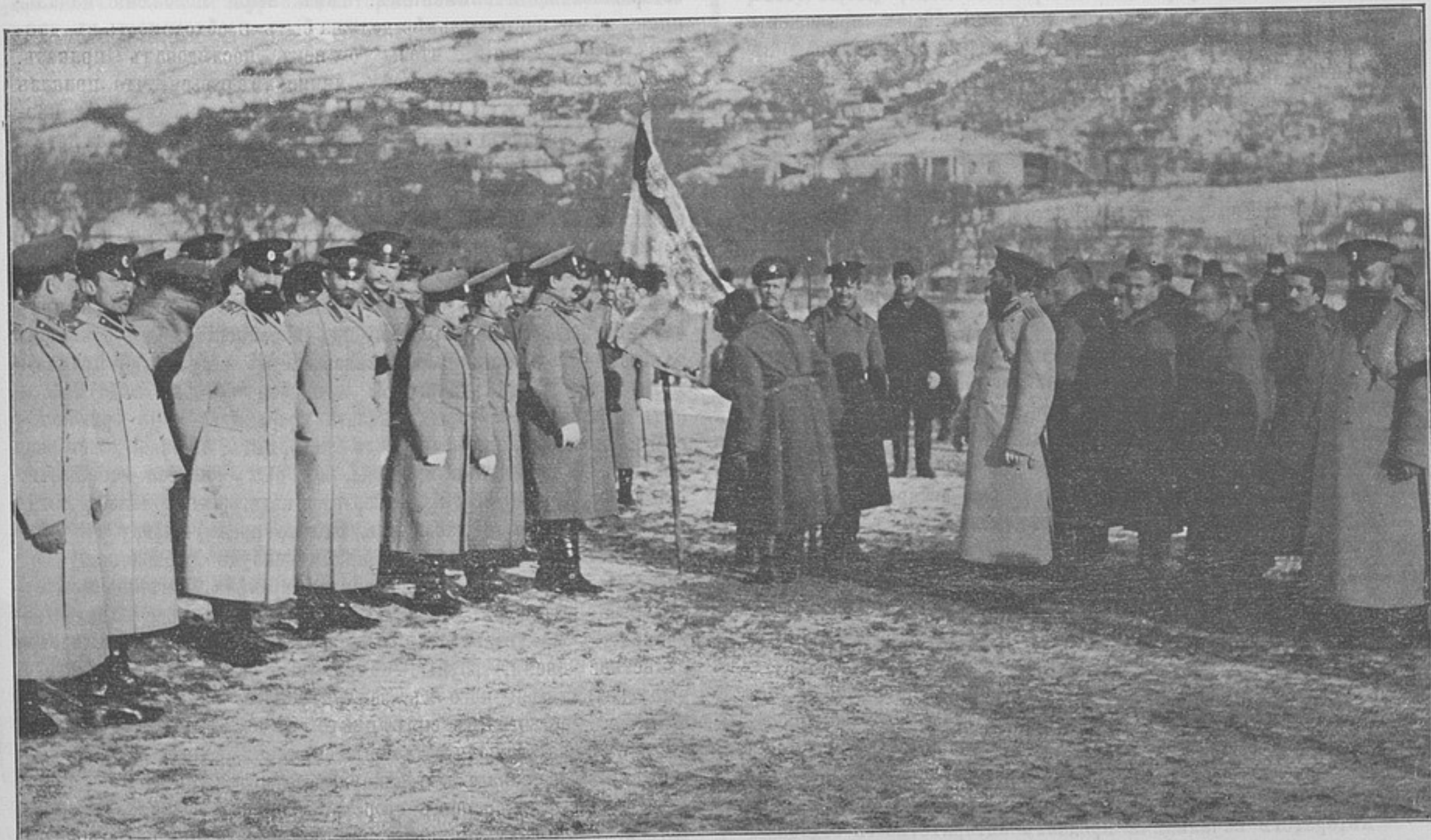
Прощаніе со знаменемъ увольняемыхъ ниж. чин. въ запасъ арміи 15-го декабря 1908 г. (Къ кор. «Могилевъ-Подольскій»).

Для примѣра укажемъ на распоряженіе одного изъ высшихъ начальниковъ—не допускать вольноопредѣляющихся жить на вольныхъ квартирахъ. Воля Государственного Вождя по этому поводу была такова, что вольноопредѣляющіеся могутъ жить на вольныхъ квартирахъ. Но тѣ изъ нихъ, надъ которыми требуется особый надзоръ, могутъ быть лишены этого права. Рѣшеніе вопроса, требуется ли надъ нѣкоторыми вольноопредѣляющимися особый надзоръ или не требуется, волей Государственного Вождя предоставлено усмотрѣнію ротнаго командира и начальника отдѣльной части (ст. 199 Ус. о воин. пов. и ст. 116 Ус. вн. сл.). Итакъ, распоряженіе высшаго начальника въ данномъ случаѣ нарушаетъ воинскіе законы въ двухъ направленіяхъ: нарушаетъ приказъ Государственного Вождя, предоставлявшій льготы вольноопредѣляющимся, и вторгается въ кругъ дѣятельности, очерченный волей Государственного Вождя для командира части. Нарушаются одновременно и дисциплина, и инициатива. Вырвавъ изъ рукъ командира части средство, предоставленное ему Высочайшей властью, можно ли сдѣлать его отвѣтственнымъ за порядокъ въ части? Нуженъ ли полку командиръ, когда высшее начальство само будетъ хозяйничать въ полку? Вѣроятно низведеніе начальника на роль пассивнаго наблюдателя—явленіе не рѣдкое въ военной службѣ, разъ что потребовалось новое волеизъявленіе Государственного Вождя, давшее второе дополненіе къ ст. 24 кн. VII С. В. П. (Пр. по в. в. 13 ноября 1908 г. № 510).