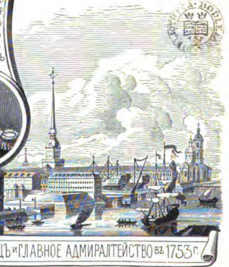
ЗИМНИЙ ДВОРЕЦЪ И ГЛАВНОЕ АДМИРАЛТЕЙСТВО ВЪ 1753 Г.