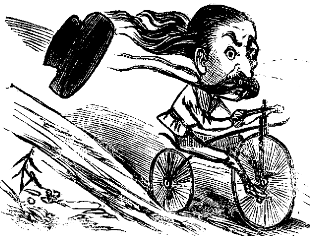
Primesdiós'a coborire de pe unu dealu.