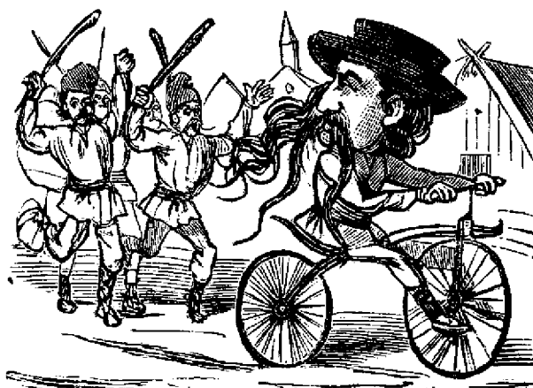
— Éta necuratulu! Haidati sê-lu batemu!