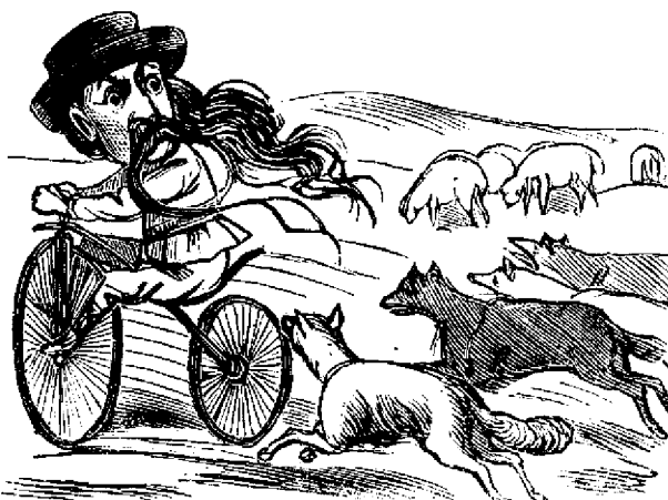
Abié iese din orsiu la campu, canii de la oi toti se luara dupa elu.