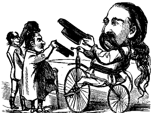
„Gur'a Satului“ plăca la Siomeut'a pe velocipedu.