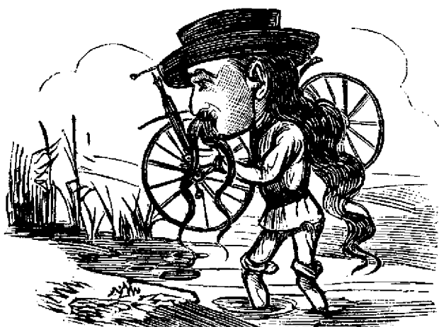
Ajungandu la o balta, fu silitu a luá velocipedulu in spate si a trece pedestru.