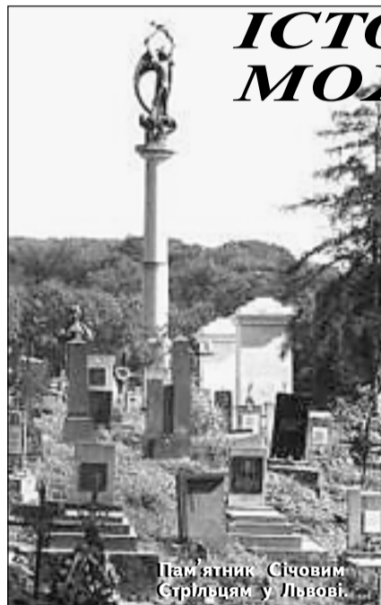
Пам'ятник Січовим Стрільцям у Львові.