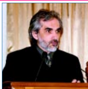
Ярослав ГРИЦАК, доктор історичних наук.

Заступник глави Адміністрації Президента України подякував Сергію Куніцину за його роботу: «За цей час Представництво отримало нове звучання, були налагоджені процеси координації, співробітництва органів кримської влади. Від імені Президента України я хочу висловити Сергію Володимировичу підтримку і ще раз побажати міцного здоров'я», - сказав Олег Рафальський. (Продовження на 2-й стор.).