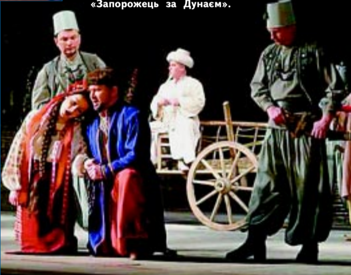
Сцени з опери «Запорожець за Дунаєм».

чно!.. Проте в зрілому віці я знову перечитав повість М. Коцюбинського «Дорогою ціною» і побачив здивовано, що в ідейно-тематичному плані опера й повість такі «схожі» між собою, як ніч і день, бо головні герої повісті