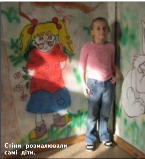
Стіни розмалювали самі діти.

– Можна сказати і так. Ми не лише дотримуємося за дітьми.