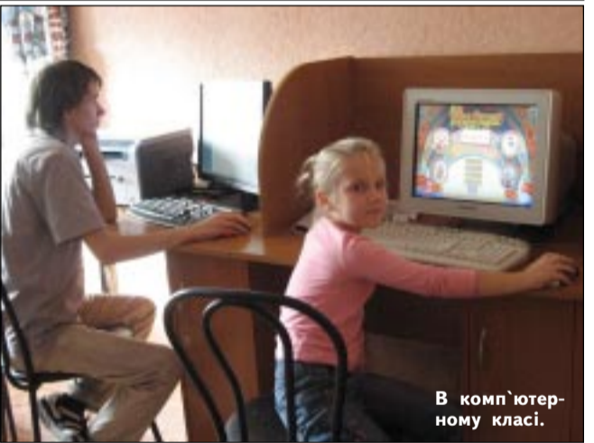
В комп'ютерному класі.