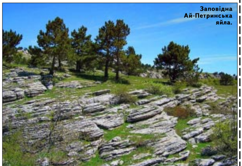
Заповідна Ай-Петринська яйла.