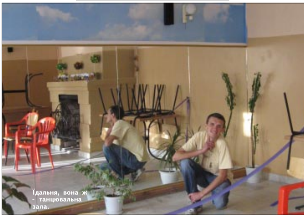
Ідальня, вона ж – танцювальна зала.