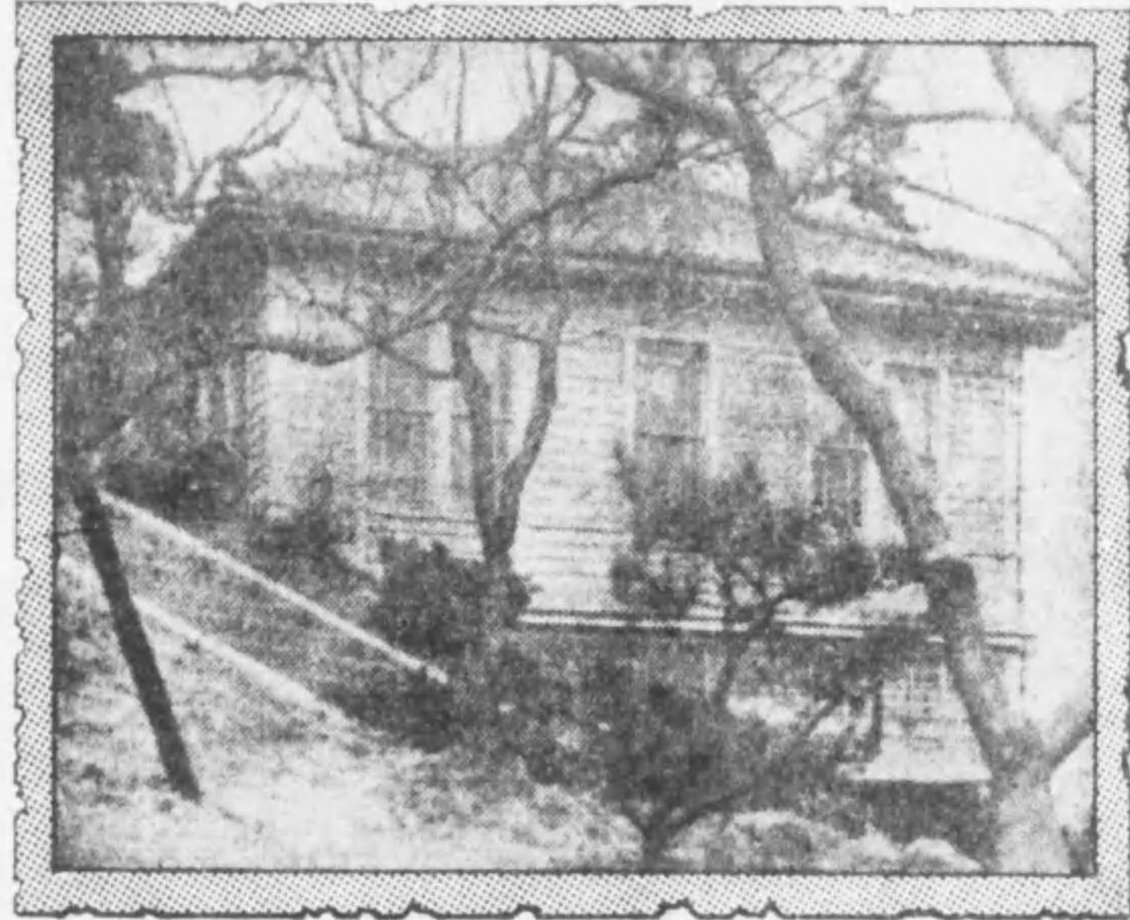
府立圖書館金景 所在辨天册二十畝地龍頭山公園內