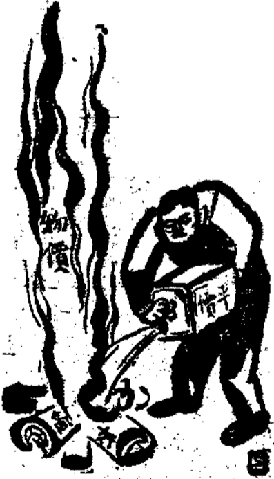
那水是不那，吡錯，友朋！喂 (生編) | 油汽為

本刊登記度內政部警字六八七三號 中華郵政掛號特准立券作為新聞紙類 本期原稿經浙江省圖書雜誌審查委員會發給岩字第二一九號審查證