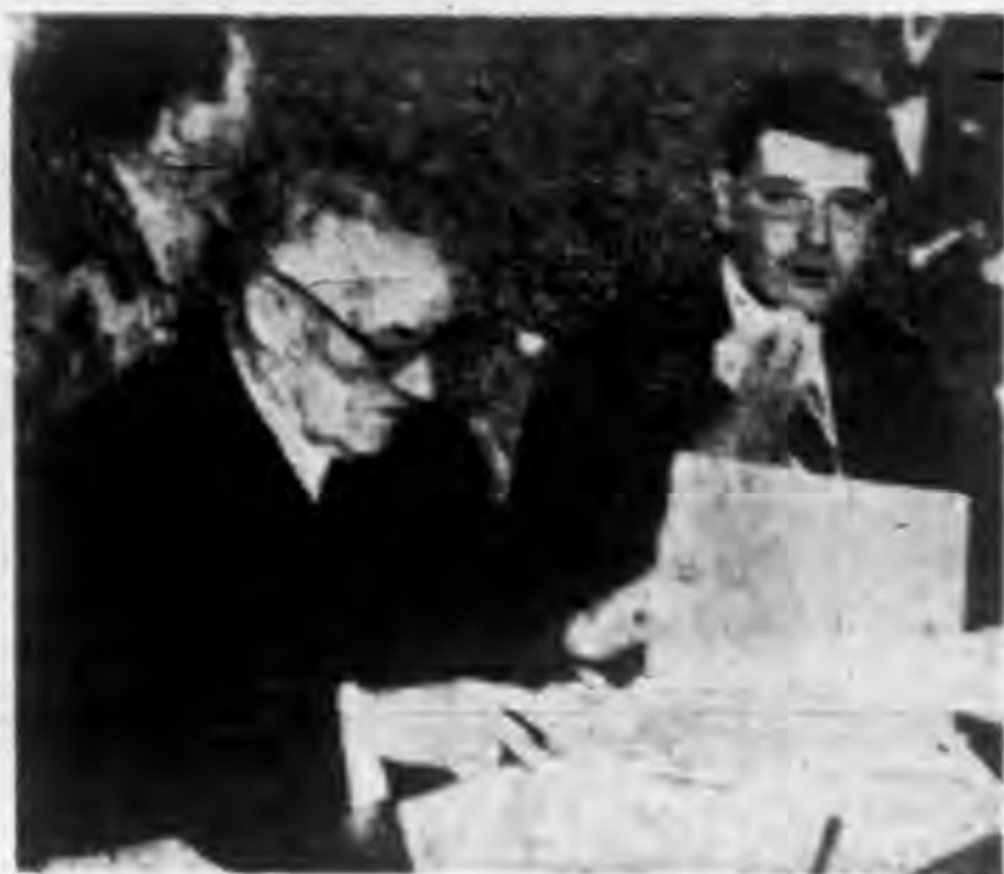
↓ 蘇聯出席聯合國大會首席代表蘇外交 次長維平斯基(Andrey vishlosjy)