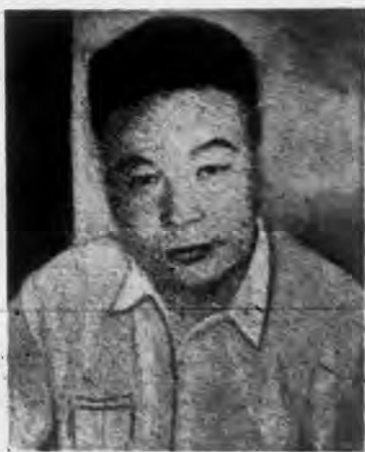
↑ 在上海打虎的蔣經國