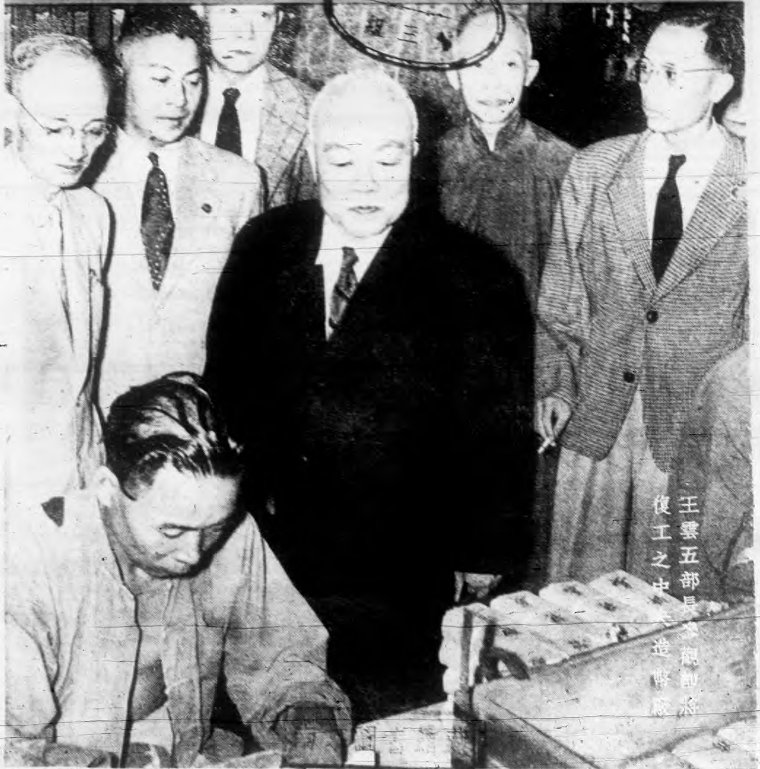
王 雲 五 部 長 參 觀 製 造 廠 復 工 之 中