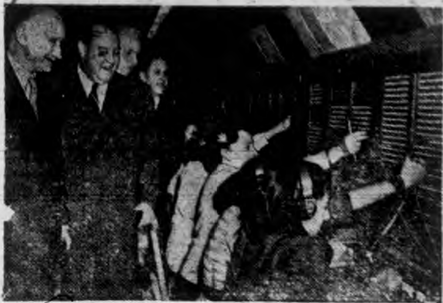
↑ 法國外長許曼(左)偕同聯合國秘書賴伊在巴黎夏樂宮中視察本屆聯大籌備工作之進行。圖中為電話間接線情形。