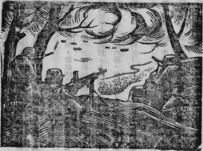
我精確射擊擊沉敵艇十三餘艘

至晨五時，敵機三十餘架分佈於我陣地上空。以廣泛之轟炸掃射，壓制我軍火力，監視我軍運動，營田鎮爲之炸爲焦土，營田附近村落，亦被炸光，卽獨立之樹或森林敵亦密集射擊。敵陸軍因感我軍正面抵抗相當堅強，乃向東五家坪一帶實行小迂迴。在我