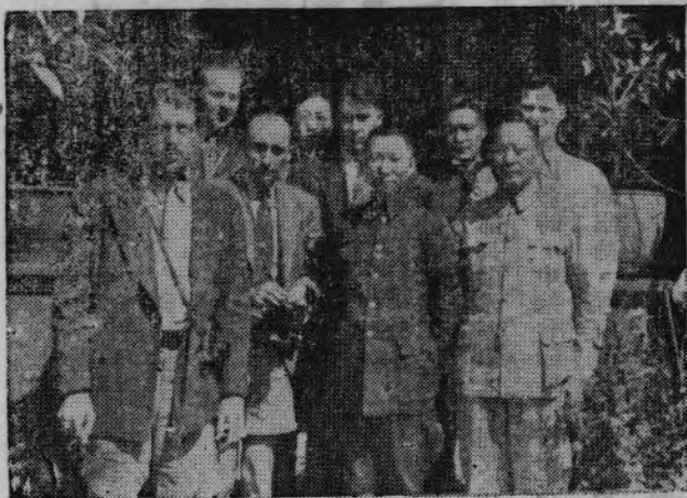
丁馬 登塘 薛官長 光顯堂 (排前)左至右自 德拉學 舟竹劉 明夏靈 蘋麟周 徒司 (排後)

無其事，經余實地視察後，可答之曰，確有其事。余等在前方會目擊各部隊與新聞記者密切合作，使各項消息，得以迅速傳出，實堪稱道。此次湘北大捷，中央社所發布之前方消息，迅速確實，其所得之後果，當極偉大，對於日方之一切暴行，曾謂根據華方所稱述者，在金井、福臨鋪、青山市等地，先後向許多民衆詢問，內容完全一致，足證均係事實。嗣又詢及一般問題，彼等稱，目前之傷兵問題，由於前方各地遍設傷兵招待所，已得到合理的解決。沿途所見軍民合作之精神，亦可欽佩。而軍民之抗戰情緒，愈到前方，愈為高漲，尤為最後勝利之保證等語。又各外籍記者昨在某地與陳