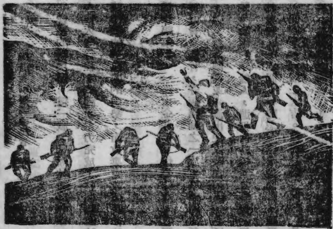
了開展戰見白的門決的人與人去山下敵軍戰了出們兄弟

水，地形優勢。敵一再以猛烈砲火攻擊，均告無效。因而使敵人不得不尋最弱一點，以突破之。當時我福林鋪南之石渡神陣地，即遭敵猛襲，並極力向側後迂迴。我們的預備隊，就馳往增援，並迂迴敵之側背，形成反包圍。迫擊砲亦實行超越射擊，砲彈從空中落在敵人密集的队伍裏，骨肉挾着砲