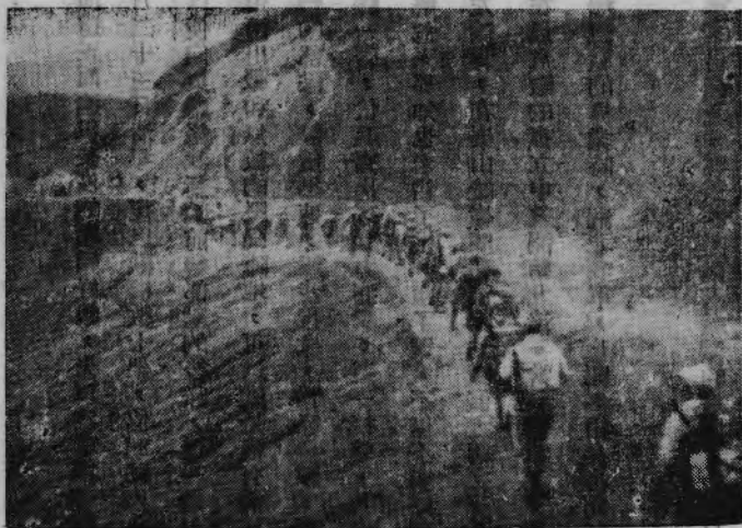
二百五十五里的窮追

鄂南崇、通間的甘柏師團，是敵人的中路，任務重大，一面是策應贛北中井師團的西進，一面是和湘北南下的敵人呼應，預計這一着必出我軍意外，毫無阻擋的從幕阜山中的險僻小道，竄到瀏、平中間。這完全是百分之百的碰彩，靠幸運的冒險行爲。可是「皇軍」并不能「抬頭見喜」，一出門碰到的也不是幸運，在通城東南的賽市、南樓嶺一帶，却碰到了我們堅強的抵抗。敵