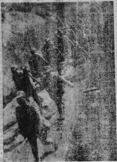
蕩 浩 的 行 列

全綫反攻。我佈置完竣後，日軍主力部隊即已到達橋頭驛北之王姐橋及福臨鋪南之青山市，我