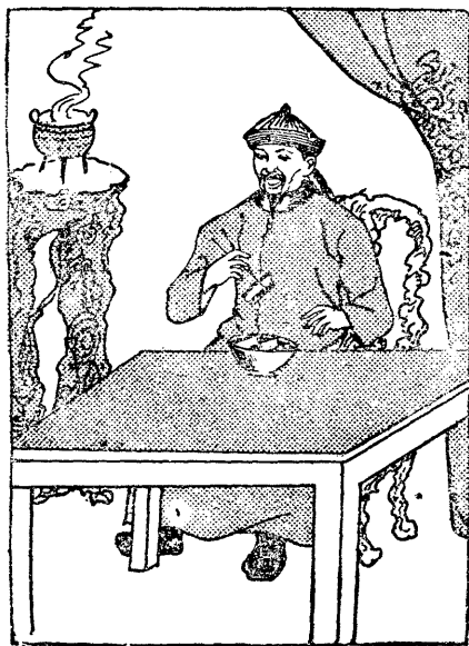
每天要吃十幾斤肉