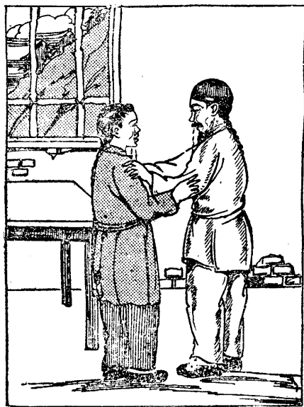
父子兩個忍不住抱着哭了