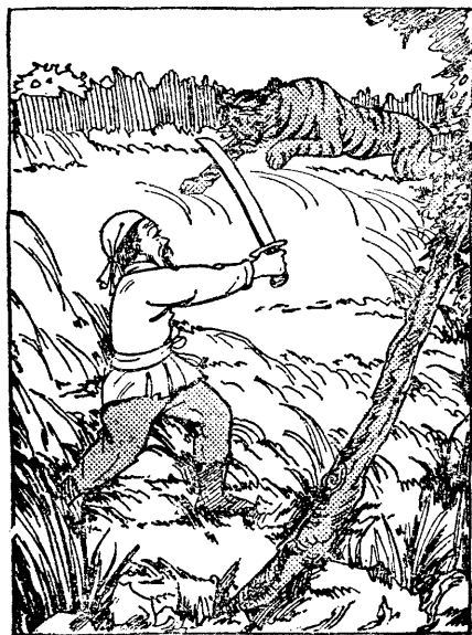
老虎很凶地撲了過來