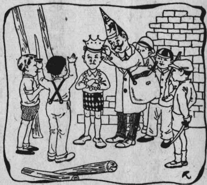
着圍子孩羣一，來人藥賣