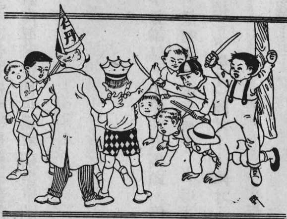
上身的手徒在騎人的刀有槍有