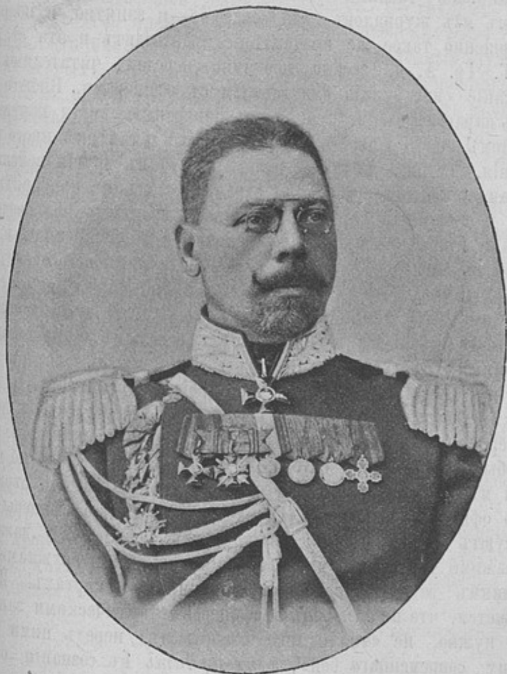
Окружной интендантъ Варшавскаго военнаго округа, генеральнаго штаба генераль-маіоръ

За границу на годъ 8 р.; на 1/2 года 5 р. Деньги могутъ быть высланы почтовыми марками, каждая не дороже 50 к. Безденежная подписка не принимается. За перемѣну адреса 25 к. Отдѣльные №№ выслаются за 15 к. Объявленія принимаются по особой расцѣнкѣ, высласмой по требованію.