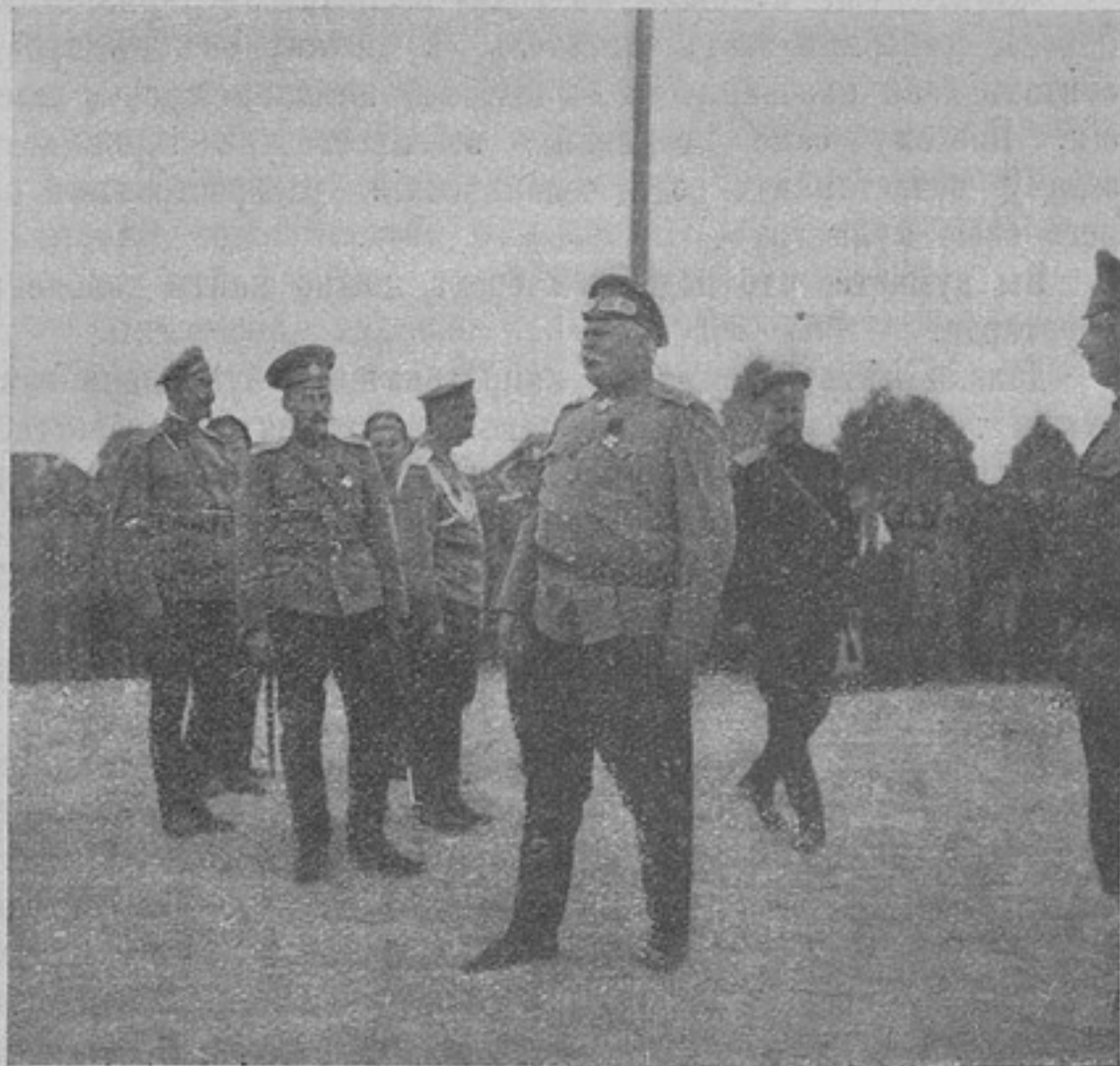
Генералъ Лешъ на позиціяхъ.

условіяхъ сдачи могла быть рѣчь, когда въ это время двѣ роты Кл.....въ были уже въ Перемышль у крѣпостного штаба и поручикъ Б.....въ уже обезоружилъ весь штабъ, въ томъ числѣ и ген. Кусманека; туда же вошли двѣ сотни уральцевъ и полурота саперъ.