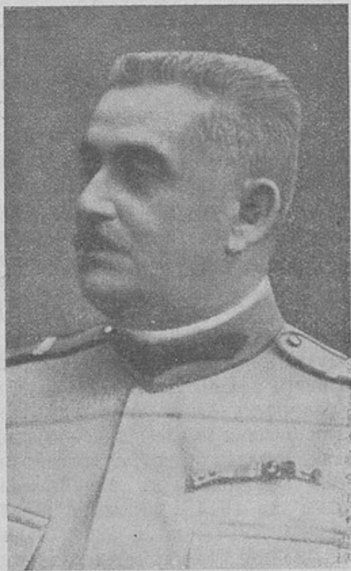
Начальникъ штаба румынской арміи генералъ Иліеску.

26-го сентября. На владимиро-волинскомъ направленіи, въ районѣ Затурцы—Шельвовъ—Бубновъ, мѣстами наши войска прорвали расположеніе противника и укрѣпились на занятыхъ позиціяхъ.