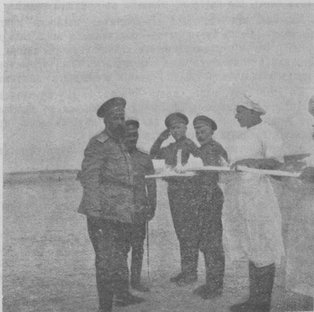
Проба паца генераломъ Царскимъ.

Завѣса, искусно скрывавшая германца, спала, и весь міръ увидѣлъ не носителя высшей культуры и даже не варвара, а утонченнаго злодѣя, творящаго свои злодѣянія со всѣми признаками садизма.