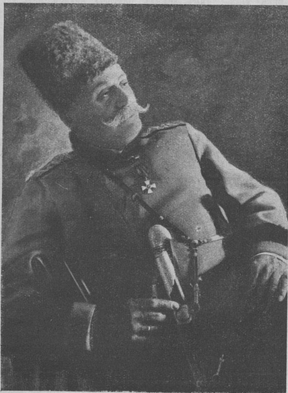
Генераль-лейтенантъ Габаевъ, награжденъ орденомъ Св. Георгія 4-й степени.

— Евиаторійскаго пѣхотнаго полка, прапорщику Альфонсу-Герберту-Рейнольдъ Гейсту за то, что 7-го марта 1915 г. командуя 8-й ротой, на высотѣ 750 у д. Локіецъ, во главѣ своей роты бросился въ штыки, ворвался въ окопы противника, занялъ ихъ, взялъ плѣнныхъ и одинъ дѣйствующій пулеметъ, причемъ самъ палъ смертью героя, явивъ примѣръ неустрашимости, отваги и самоотверженія.