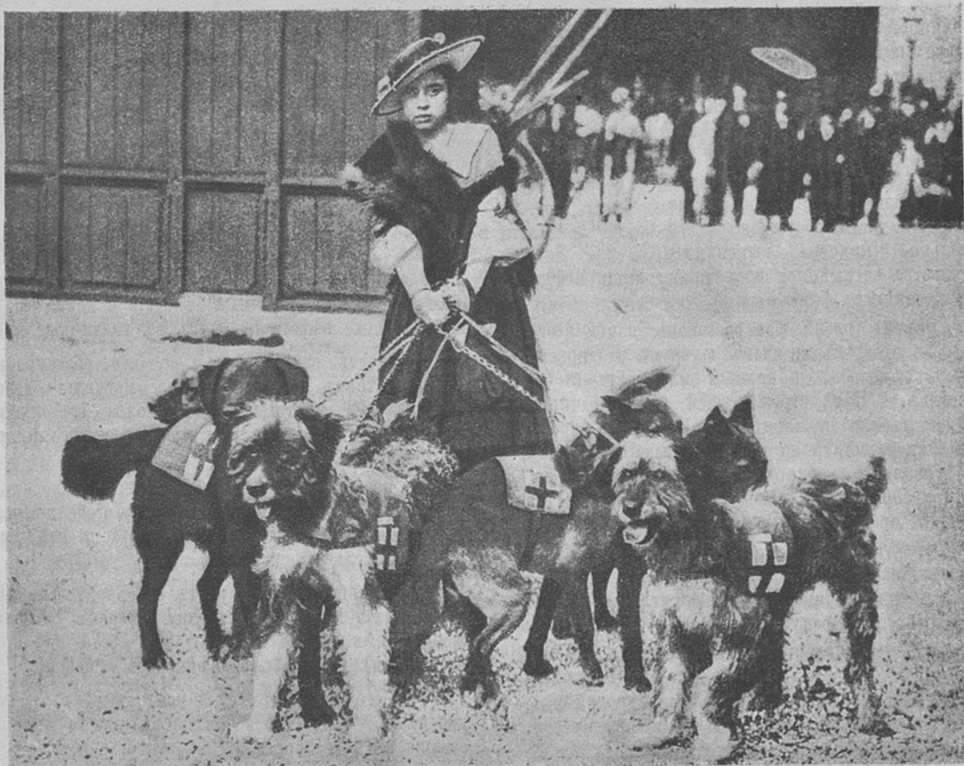
Французскія санитарныя собаки.