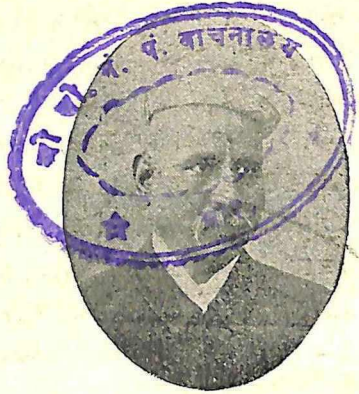
रा. व. रं. न. मुधोलकर, वांकीपूर—१९१२.