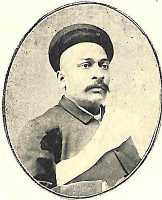
दाजी आबाजी खरे जा. जनरल सेक्रेटरी (माजी)