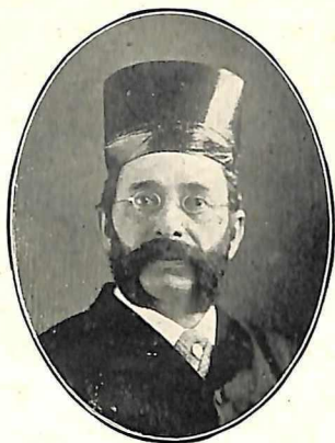
सर फरोजशाहा मेथा—कलकत्ता १८९०.