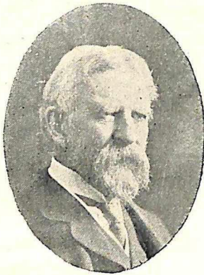
सर हेनरी काटन—सुंबई १९०४.