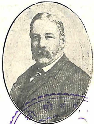
जार्ज यूल—अलाहाबाद १८८०.