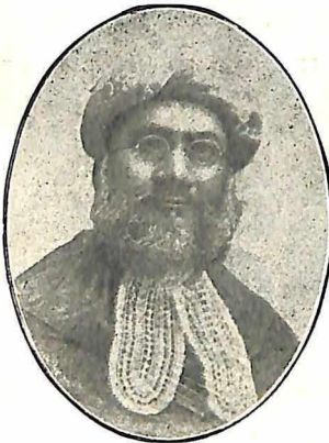
बहदुरहान तय्यबजी—मद्रास १८८०.