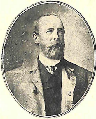
ए. ओ. ह्यूम जनरल सेक्रेटरी (माजी)