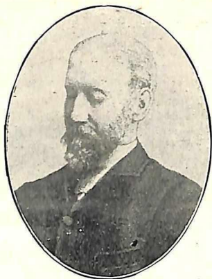
सर डब्ल्यू वेडवर्न मुंबई १८८९. उलाहाबाद १९१०.