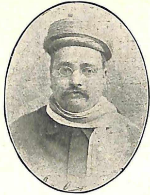
गोपील कृष्ण गोखले बनारस—१९०५. जा. जनरल सेक्रेटरी (माजी)