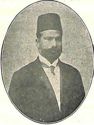
नवाब सय्यद महमद, कराची—१९१३. जा. जनरल सेक्रेटरी.