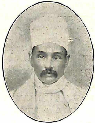
पंडित मदन मोहन मालवीय लाहौर—१९०९