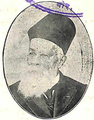
दादा भाई नौरोजी कलकत्ता १८८६. लाहोर १८९३. कलकत्ता १९०६.