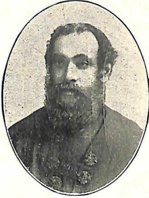
सुरेंद्रनाथ बानर्जी पुणे—१८९५. अहमदाबाद—१९०४.