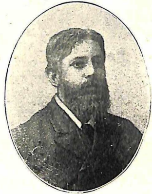
ए. एम्. बोस—मद्रास १८९८.