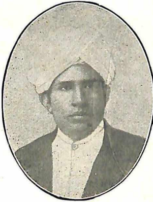
सर शंकर नायर—उमरावती १८९७.