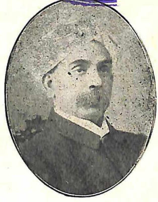
सर नारायण चंदावरकर. लाहोर—१९००.