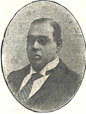
रमेशचंद्र दत्त, लखनौ—१८९९.