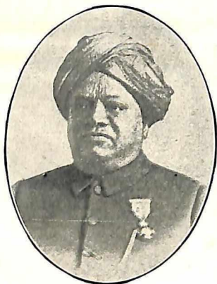
रांय व. पी. आनंदाचार्लू—नागपूर १८९१. जा. जनरल सेक्रेटरी (मार्जी)