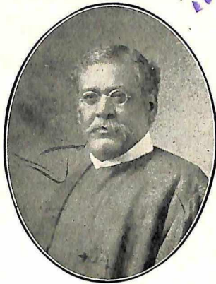
डा. सर राश बिहारी बोस सुरत—१९०७, मद्रास—१९०८.