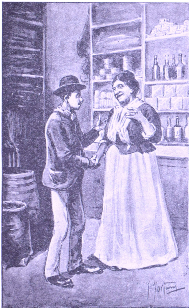
Se rió muy contenta y me dió la mano.