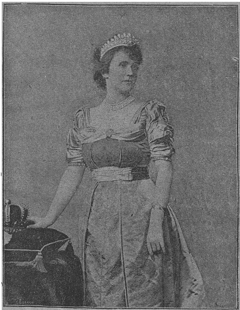
M. S. REGINA ELISAVETA.

respectată, stăpană pe destinele ei și trebuincioasă păcii europene, civilizațiunii omenesci. Fruntașul ei este în același timp mândria ei, siguranța ei, pavăza