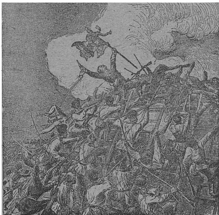
LGAREA GRIVIȚEI (30 August 1877).

gust 1877). în fruntea armatei sale. La 21 August el sosi la Plevna și luă comanda superioară peste întreaga armată ruso-română, compusă din 35.000 de Români cu 180 de tunuri și din 30.000 de Ruși cu 282 de tunuri. Un număr tot așa de mare de Turci, cu artilerie însă mai puțină, se întărise într'un chip minunat în Plevna . Acastă cetate, inconjurată jur împrejur cu dëluri, cu muchi și creste numeroase, avea trei inii de tăbii său redute. Intre aceste redute, mai bine