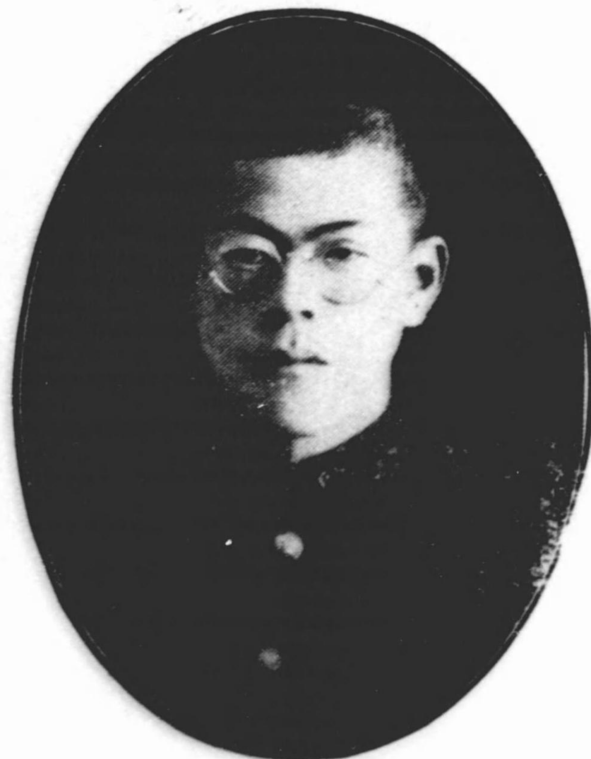
一 春 澤 長