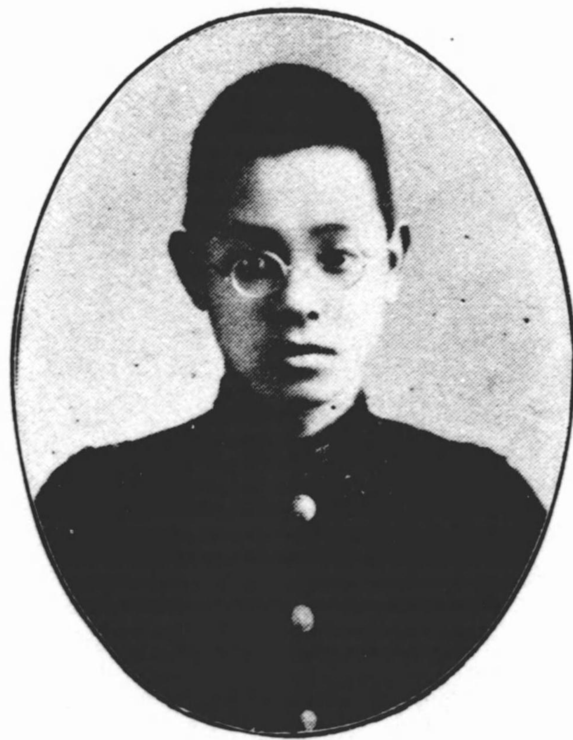
雄 森 木 三