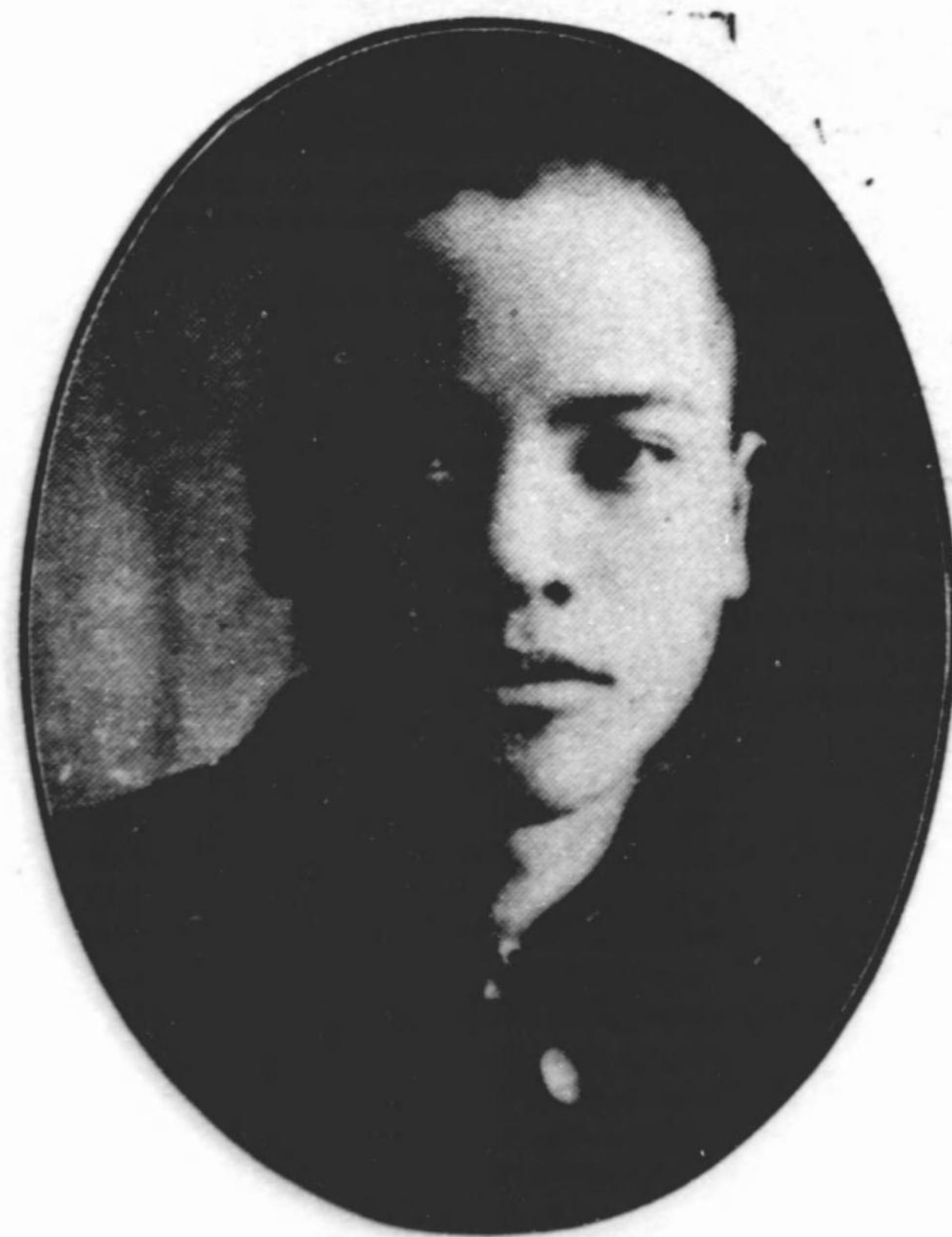
雄 貞 藤 佐