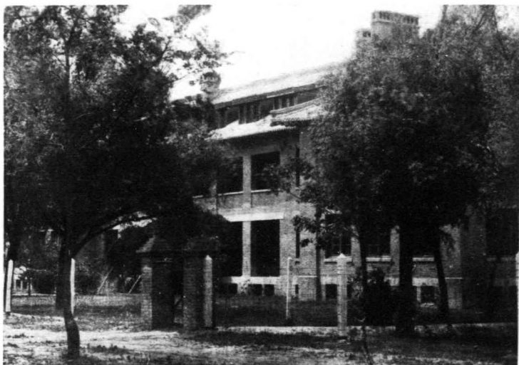
觀外堂課院學道神會浸華中