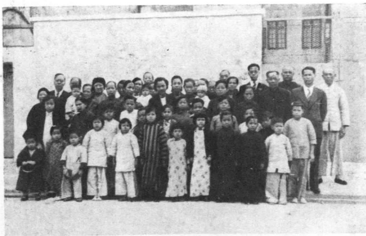
香港浸信會筭箕灣基址開幕攝影