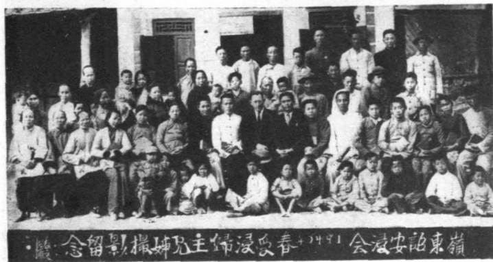
嶺東詒安會 1941年春浸信會主理人攝留紀念