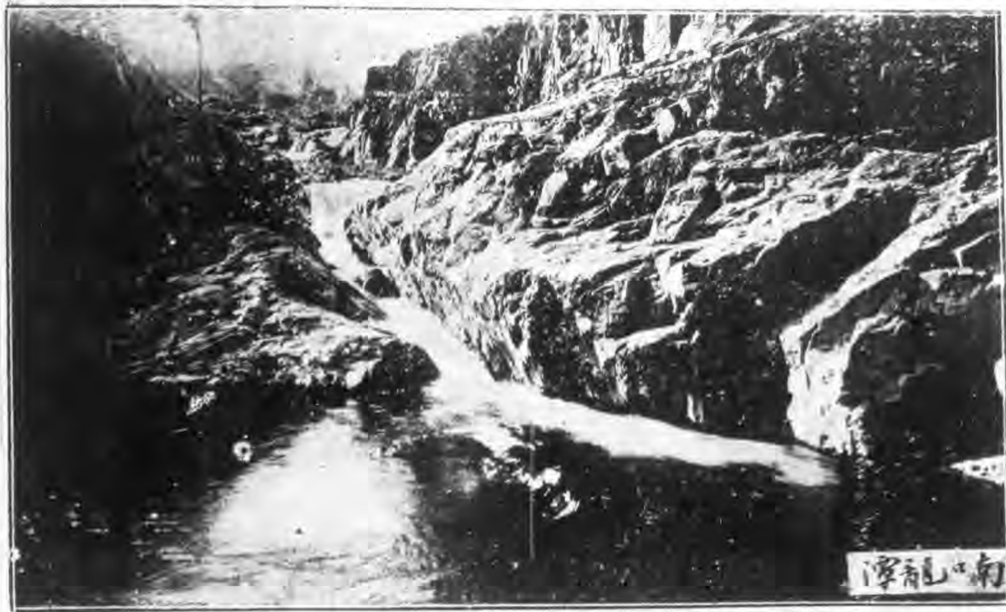
南龍潭 北口十里紅龍山下萬處深巨有壑曰龍潭衆水匯流波濤湍急居民遇旱祈雨於此峭壁刻明巖龕書龍門噴雪四字