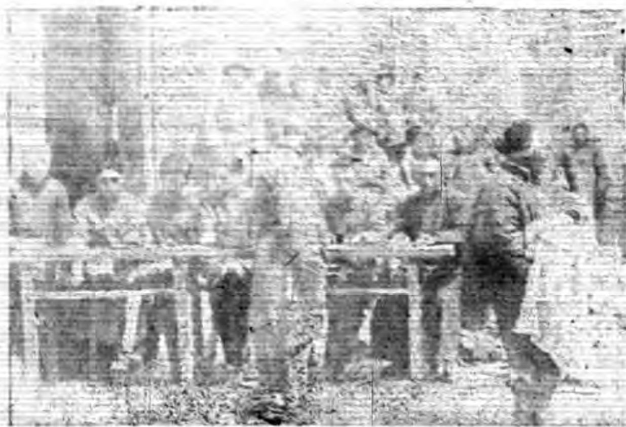
黃泥區區振衣發放情形