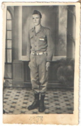
Pais de Edemir Stephani