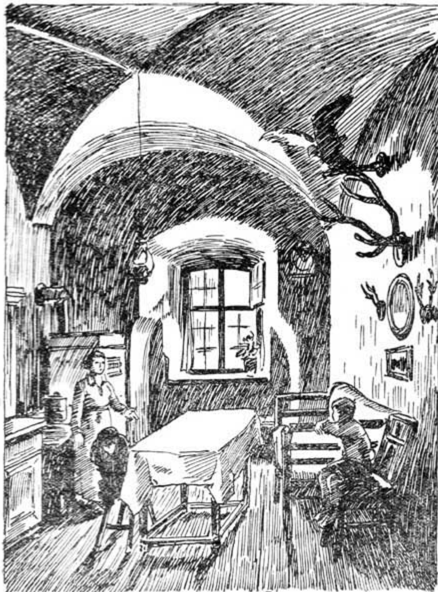
„Copak sedíš tak tiše, co?“

„To já jen tak, maminko,“ zřejmě v potlačovaných slzách láme se mu hlas.