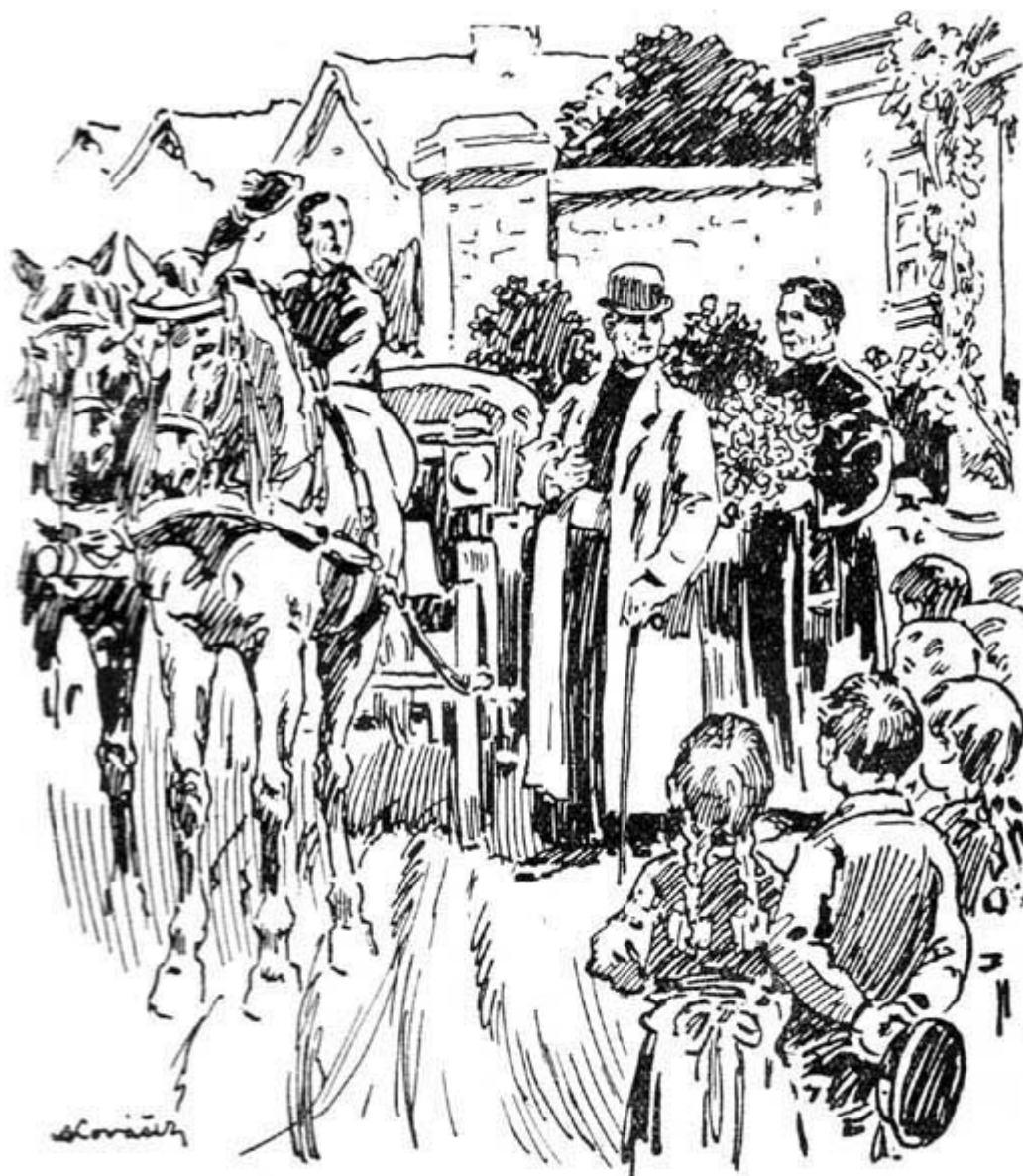
Pan farář nesl kytici . . .

Další zaniklo, protože kočí šlehl nad koňmi. Ti se rozběhli, děti volaly „s Pánem Bohem!“ Kočár zmizel v záhybu, děti se rozcházely. Kája hned za rohem chytil si Terinu: „Tak co? Už vidíš, že je to pravda, že holky jsou hloupé? S kým promluvil pan vikář naposled? Se mnou, vid’! A od koho si vzal kytku? Ode mne, protože jsem kluk!“