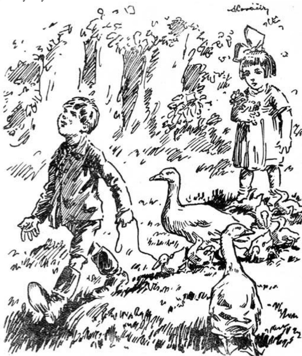
Kájovo „hajhá“ rozhlabolilo se lesem...

málokdy sedla si housata kolem starých, i pohádku jim chtěl povídat, ale najednou staré zamávaly křídly a byl všemu konec.