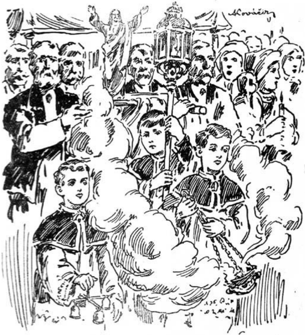
Kája zvonil oltávními zvonky ...

Pan Štulc pouštěl rachejtle. Zvysoka dopadaly k zemi drobné hvězdičky. Do vysoka rozběhly se vlasatice. Červený bengál zalil celý průvod a zase tam „U koruny“ zelený se rozzářil. Tam zase celý had ve výši se kroutil.