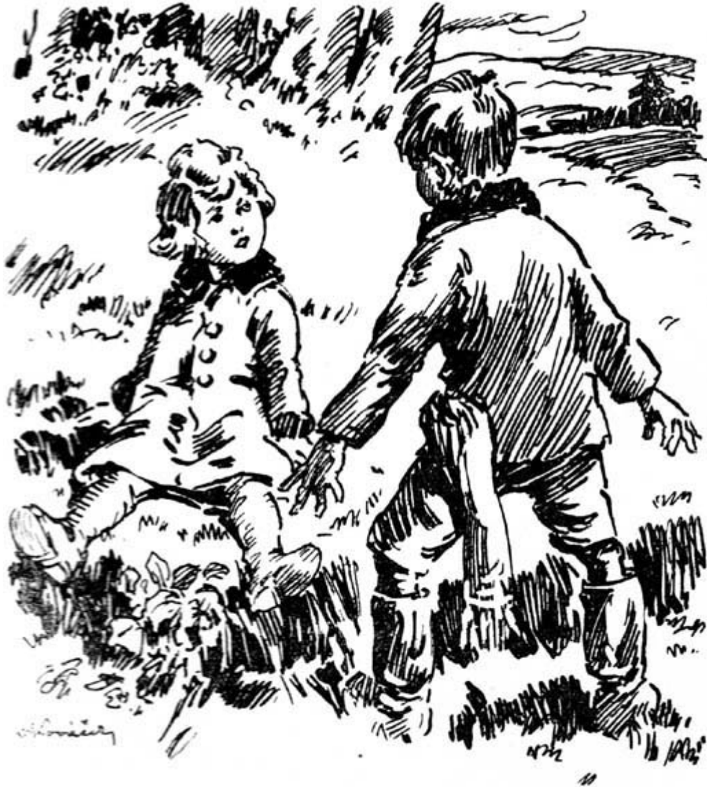
„Stáhnu ti makaše ...“

„Aby to tak nebilo do očí, kdyby náhodou šel kolem náš tatínek! Ale vtáhni do sebe vzduch! Cítíš? Jsou tu! Jsou tu někde fialky! Musíme je najít! Proto řekl vzácný pán, že tu něco najdeme.“