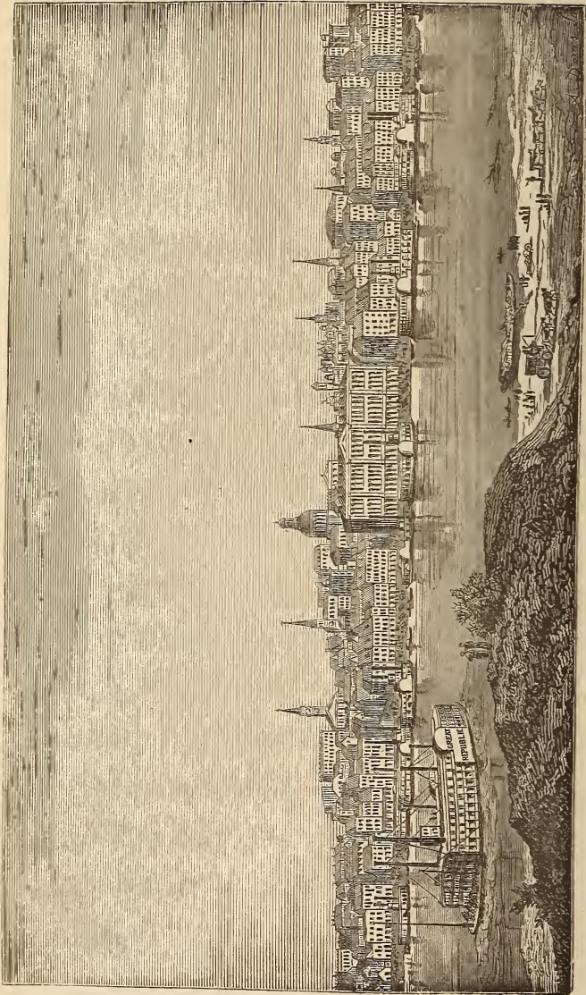
VUE DE SAINT-LOUIS DU MISSOURI (ÉTATS-UNIS).