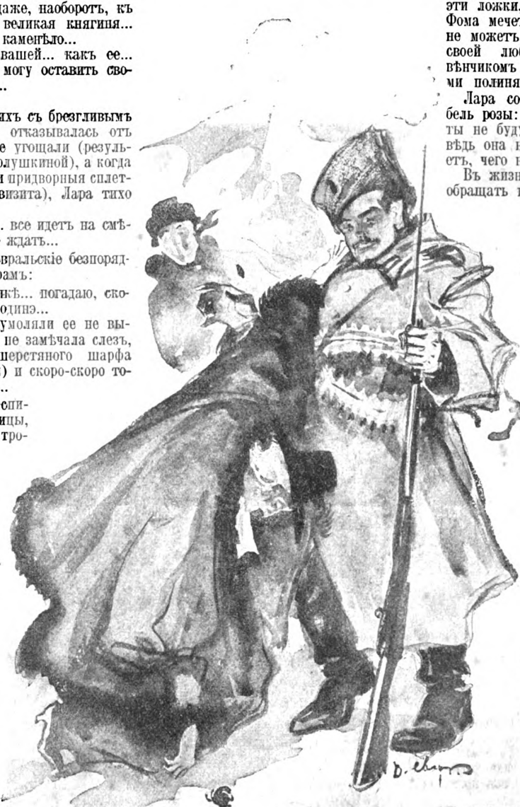
„...Лара повисла на груди солдата...“

А Лара въ бѣломъ... И въ волосахъ красная лента... Она увѣряетъ, что такъ