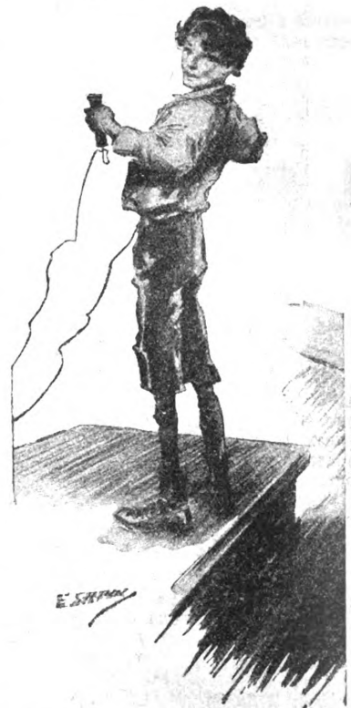
„...Генерал дал ему поиграть со смешной машинкой...“