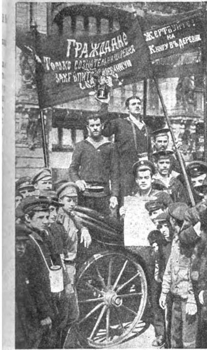
Продажа съ торга бунета цвѣтовъ. За этотъ букетъ моряки выручили 132 руб. 50 коп.

Въ воскресенье, 14-го мая въ Петербургѣ состоялся сборъ «Революціонный Петербургъ — деревня», вся выручка котораго должна пойти на покупку книгъ и популярной литературы для деревни. Въ этомъ сборѣ принялъ участіе всѣ воинскіе части петербургскаго гарнизона. По улицамъ столицы раздавали разукрашенные «Красной Гвоздикой» грузовые и военные автомобили съ плакатами. Тутъ же солдаты и моряки съ аукциона продавали публичнѣ гвоздики, цвѣты и портреты нашихъ министровъ съ автографами. Въ нихъ мѣстачъ портреты А. Ф. Керенскаго доходили съ торга до 500—800 рублей. Прекрасная погода способствовала полному успѣху сбора.