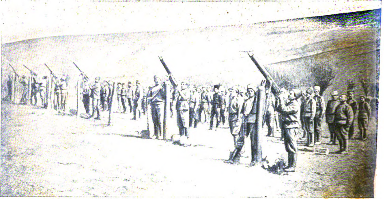
Обстрѣлъ австрійскаго аэроплана со станновъ русскаго изобрѣтенія. . . . .