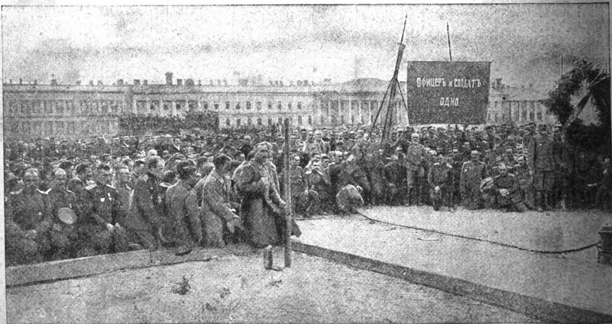
Члены Всероссийскаго съезда Офицерскихъ Депутатовъ арміи и флота у братской могилы жертвъ Революціи.

14-го мая съездъ, въ полномъ составѣ, отправился на «Площадь Свободы» — къ Марсову полю, для отдаванія долга жертвамъ революціи.