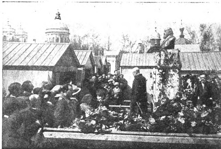
Рѣчь А. Ф. Кони на могилѣ.

14-го мая на кладбищѣ Александровско-Невской лавры открытъ и освященъ памятникъ на могилѣ М. М. Ковалевскаго. Памятникъ представляеть бюстъ М. М. Ковалевскаго изъ свѣтлой бронзы на высокомъ пьедесталѣ изъ дикой сѣрой гранитной скалы. Послѣ панихиды и освященія памятника въ присутствіи многочисленныхъ друзей, почитателей и учениковъ покойнаго великаго русскаго ученаго произнесенъ былъ рядъ рѣчей, въ которыхъ ораторы отмѣтили огромную роль М. М. Ковалевскаго въ наукѣ, общественной и политической жизни Россіи.