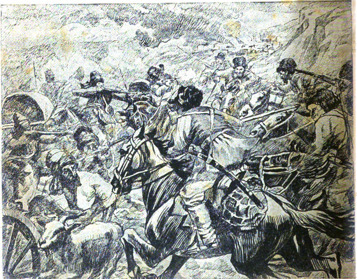
Лихой набѣгъ кубанскихъ казаковъ на караванъ дикихъ курдовъ. Казаки отбиваютъ скотъ, захваченный курдами у мирныхъ жителей.

Рисунокъ съ натуры для «Огонька» худ. П. ЖИЛИНА.