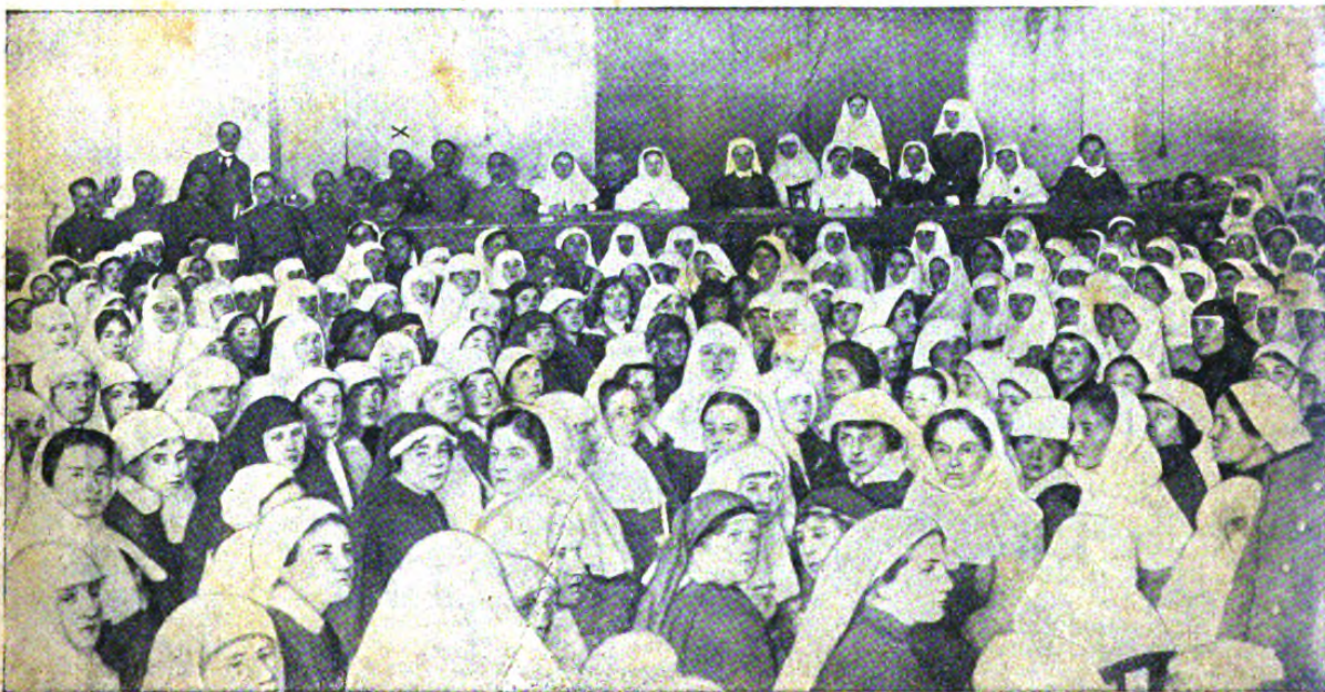
Среди президіума—главнокомандующій западнымъ фронтомъ генераль Гурко (X).