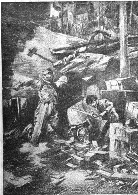
„...Он расправлялся с врагами сам...“