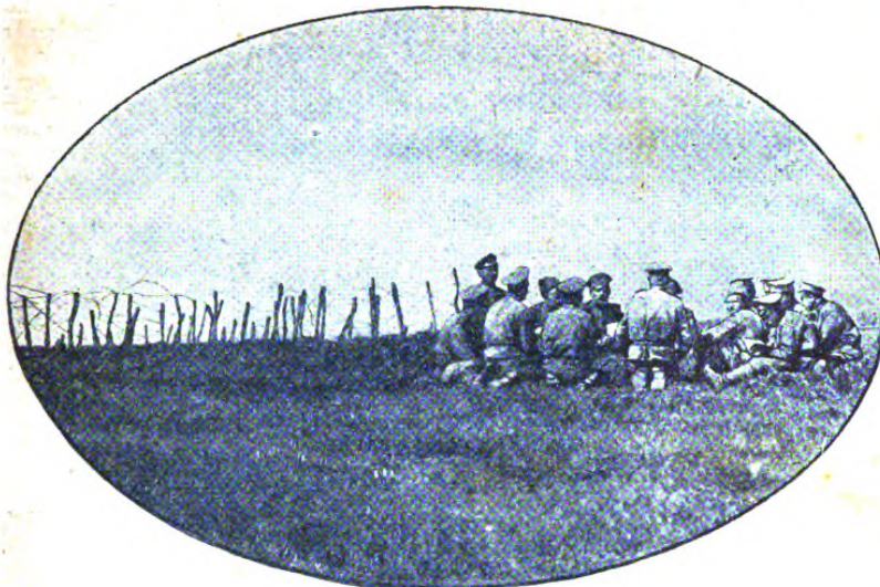
Обученіе солдатъ грамотѣ.