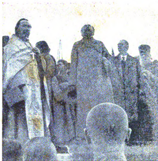
Членъ Гос. Думы о. Филоненко произноситъ рѣчь съ трибуны и провозглашаетъ ура въ честь ген. Брусилова.