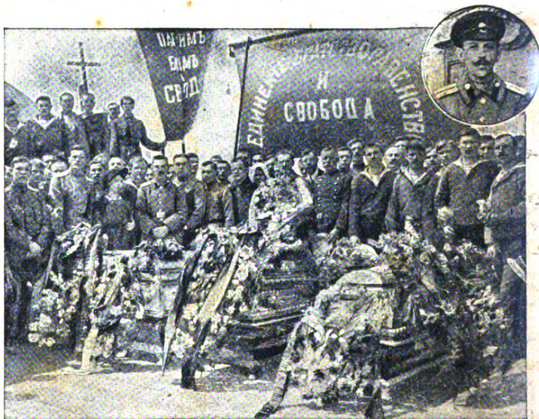
На борту крейсера «Принцесса Марія».