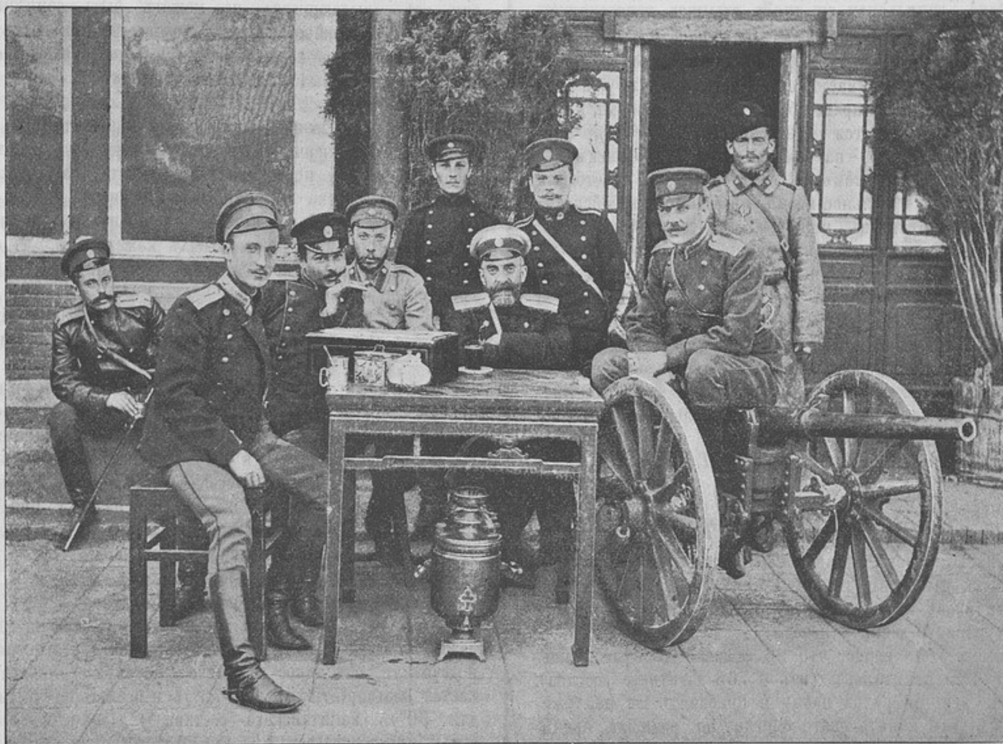
Изъ жизни русскихъ войскъ въ Манчуріи. Командиръ и офицеры дивизиона Приморскаго драгунскаго полка передъ своей квартирой.

Допустимъ, что хлѣбъ, обмундированіе, готовый обѣдъ и т. п., все это войска получаютъ изъ специальныхъ учреждений, въ которыхъ служатъ и получаютъ содержаніе отъ казны легіоны офицеровъ, чиновниковъ, поваровъ, хлѣбопекровъ, портныхъ, кузнецовъ, слесарей и т. п. Однимъ словомъ — разорвался мундиръ, сломалась подкова, оторвалась подметка отъ сапога, все это, по распоряженію ротнаго командира, отправляется въ соответствующую мастерскую и готово — солдатъ опять можетъ рвать, сколько угодно, отговариваясь «плохо было починено» и т. д.