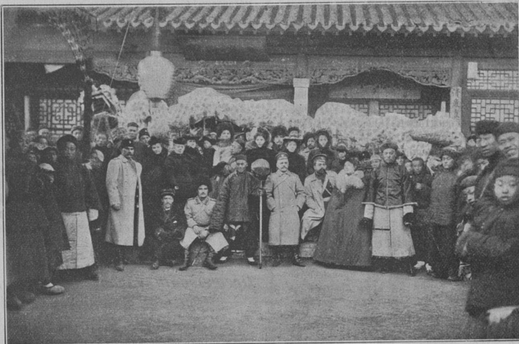
Русскіе офицеры съ полковыми дамами въ гостяхъ у Тифунгуана города Ляояна.

спеціальная сторона обученія: «практическое ознакомленіе съ формами дѣловыхъ сношеній, составленіе мѣсячныхъ рапортовъ, входящихъ и исходящихъ журналовъ и порядокъ содержанія письменныхъ канцелярскихъ дѣлъ». Изученіе этого отдѣла, кстати сказать, весьма небольшого по объему, для людей грамотныхъ не представляетъ никакого затрудненія и въ теченіе сравнительно короткаго времени—1—2