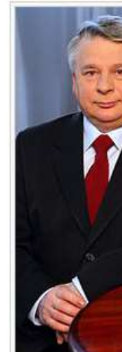
Bogdan Borusewicz Senatu VII kaden