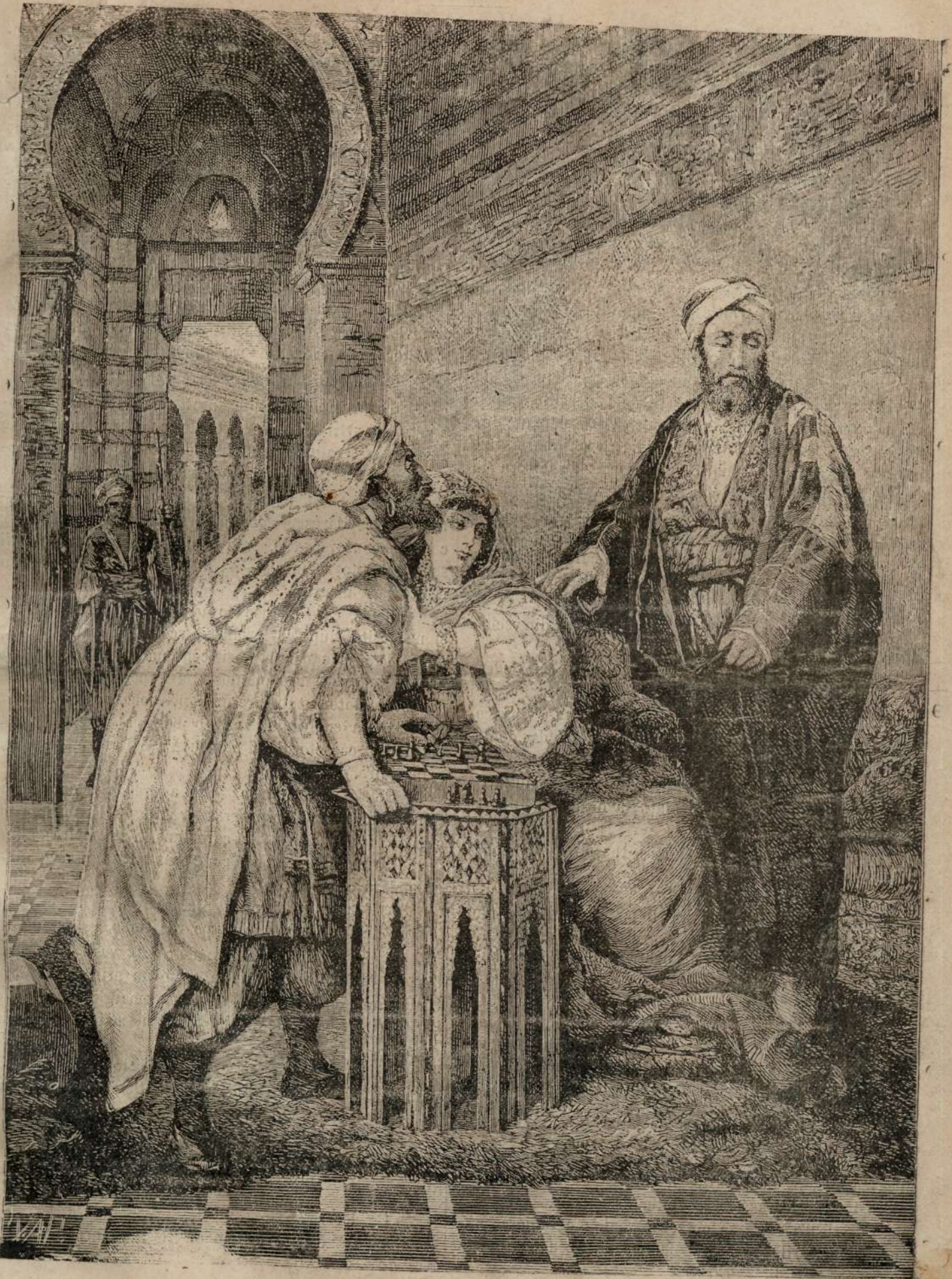
O INTERESANTA PARTHIE DE SIACU.