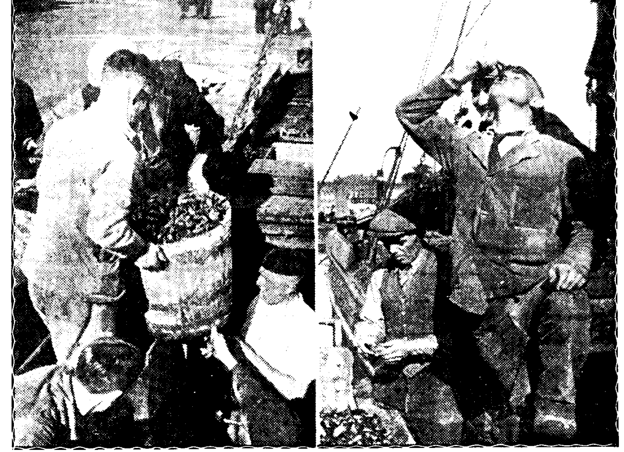
Er zijn weer mosselen — De eerste lading van de kweekerijen in de Pijp onder het Griendt tusschen Harlingen en Terschelling is te Amsterdam aangekomen. De mosselen werden snel van de hand gedaan en de kerner vond ze zelfs rauw uitstekend smaken (Pax-Holland-De Haan m)