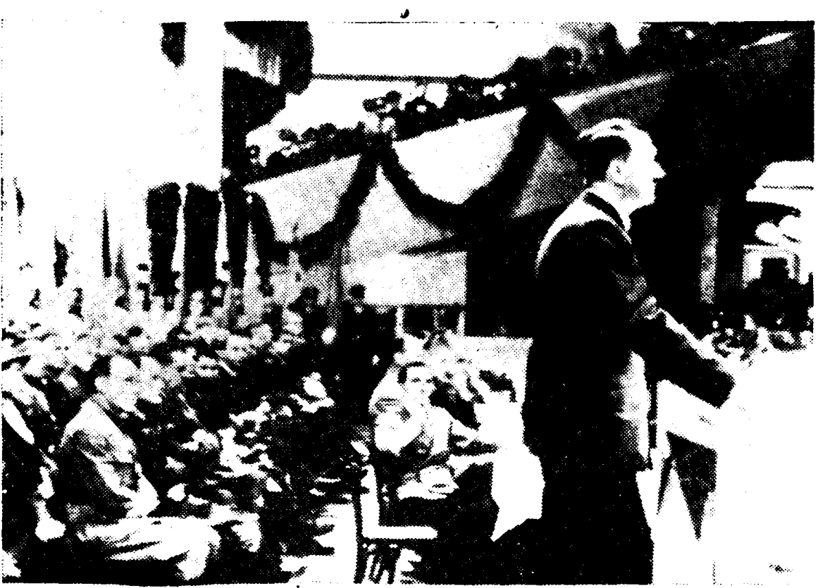
De Führer tijdens zijn groote redevoering

En zoo kan de verzuchting „Wat is waarheid?” opkomen uit het besef van onze zwakheid en de aanhef van een gebed om deugd.