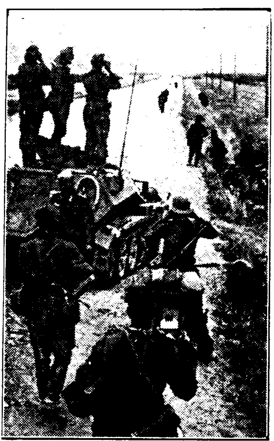
Aan het Oostfront. — Met den kijker wordt de uitwerking van het vuur der Duitse artillerie op de Sovjet-stellingen bespied. Dan kan de strijd van man tegen man weer beginnen