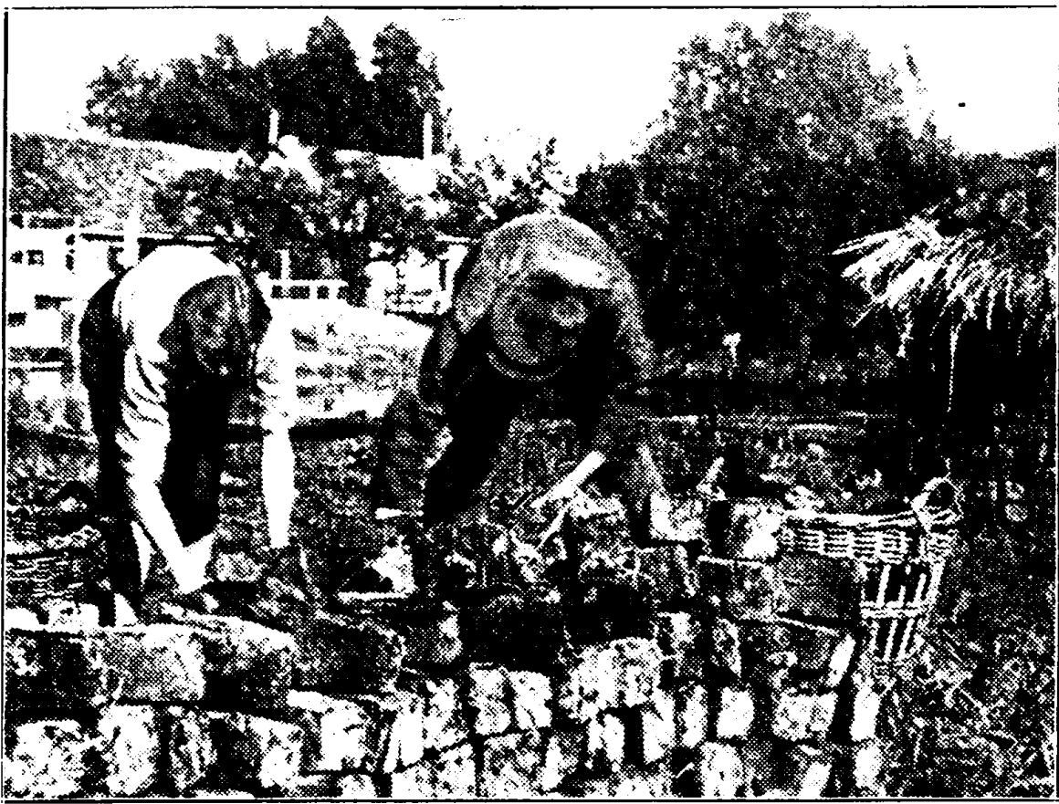
Voor de Vinkeveense turf bestaat thans een belangstelling, zooals men in die streken nog niet heeft beleefd. — De verveners hebben druk werk en ieder helpt een handje mee