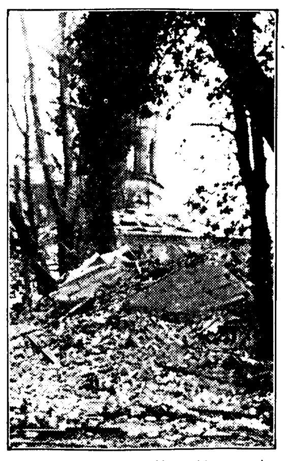
Sovjet-vandalisme in Kiev. Alvorens de stad prijs te geven, lieten de vluchtende bolsjewisten in der haast nog kerken en gebouwen in de lucht vliegen