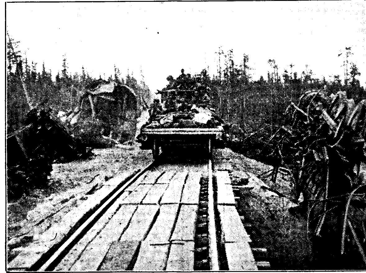
Op dit spoorwegtraject liet een Stuka een voltreffer vallen. De juist passerende sovjet-trein werd volkomen uit elkaar geslagen. Intusschen slaagden de Duitse pioniers er na de bezetting van dit terrein in, dit gewichtige baanvak in Oost-Karië in snel tempo te herstellen