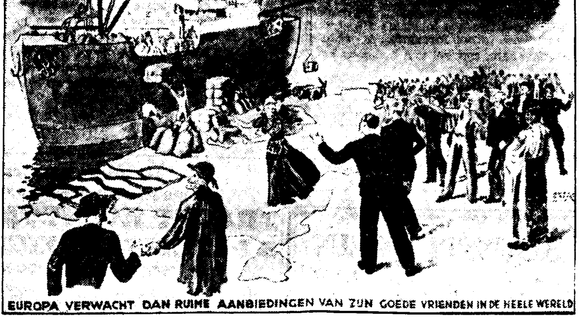
EUROPA VERWACHT DAN RIJKE AANBIEDINGEN VAN ZIJN GOEDE VRIENDEN IN DE HEELE WERELD