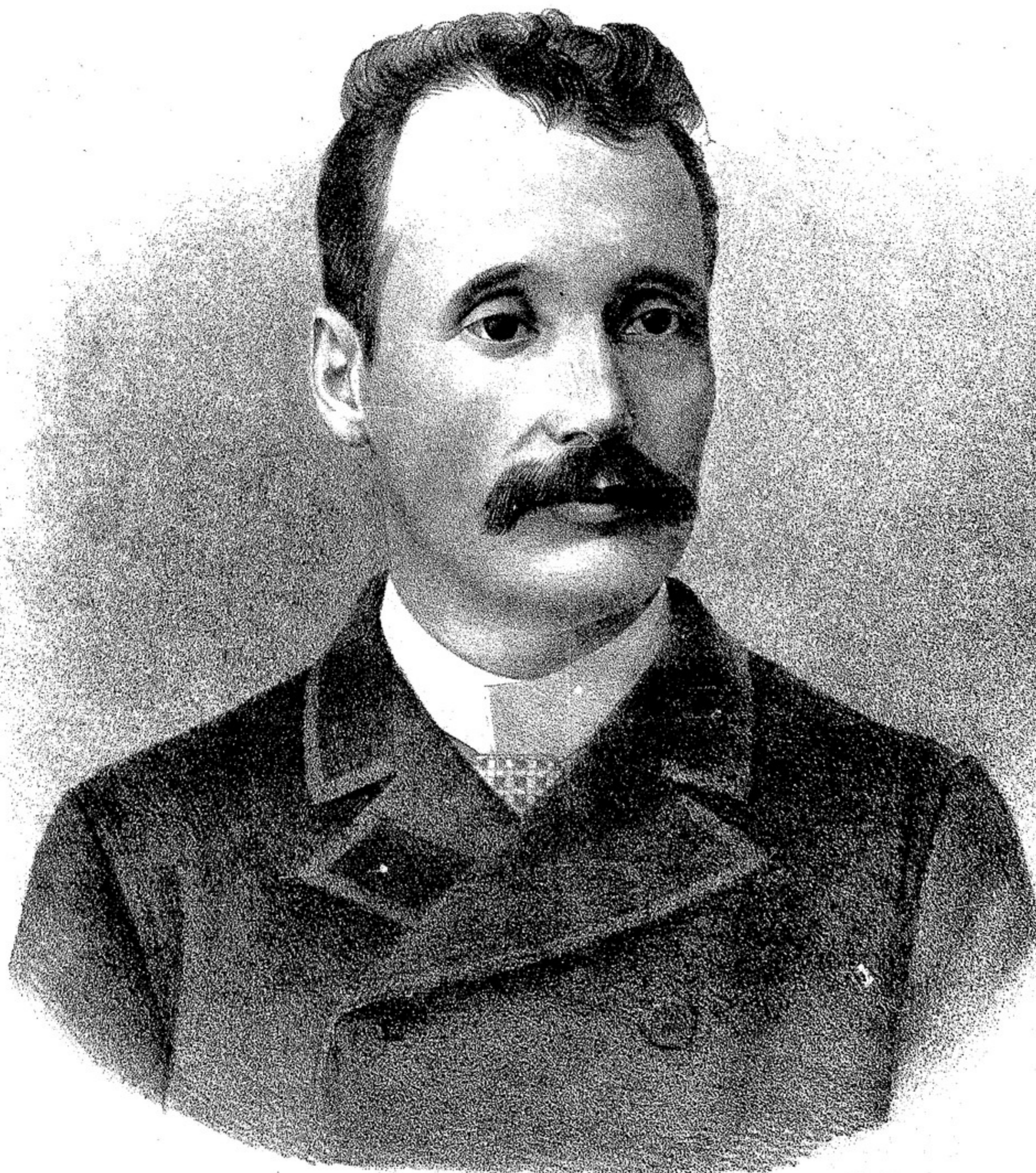
DOCTOR DON MIGUEL LAURENCENA

DIPUTADO NACIONAL POR LA PROVINCIA DE ENTRE-RÍOS Y CANDIDATO Á LA GOBERNACION DE LA MISMA PROVINCIA