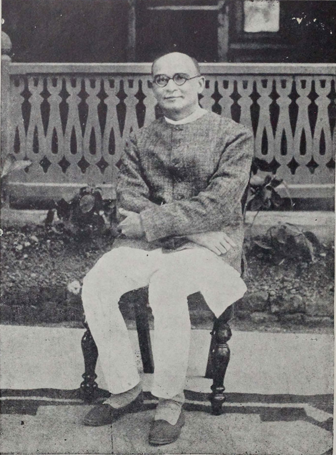
રવ. મહાદેવ દેસાઈ